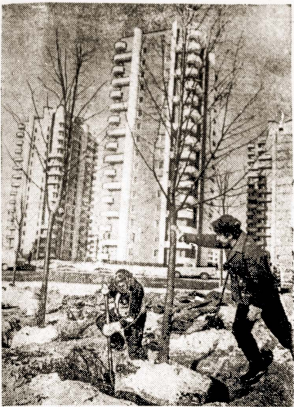
Vilniaus apželdinimo tresto darbuotojai nebe pirmą žiemą mieste sodino medžius. Su įšalusiu gruntu pasodinti, jie geriau prigryja, atsparesni ligoms.