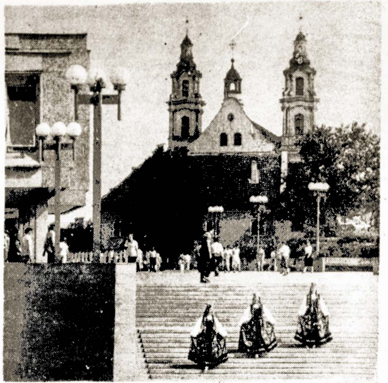
Senosios Vilniaus architektūros šedevras.