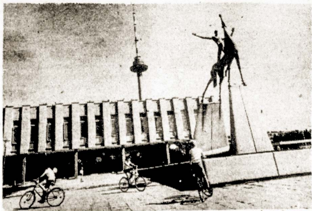
Vilniaus Lazdynų gyvenamasis rajonas. Skulptoriaus V. Karaliaus skulptūra "Rytas".

Klaipėda. — Iš viso Klaipėdos statybininkai Didžiojo Spalio 69-ųjų išvakarėse daugiau kaip dviems šimtams naujakurių atidavė keturius daugiaaukščius namus.