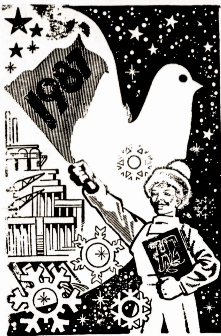
J. Buivys plakat