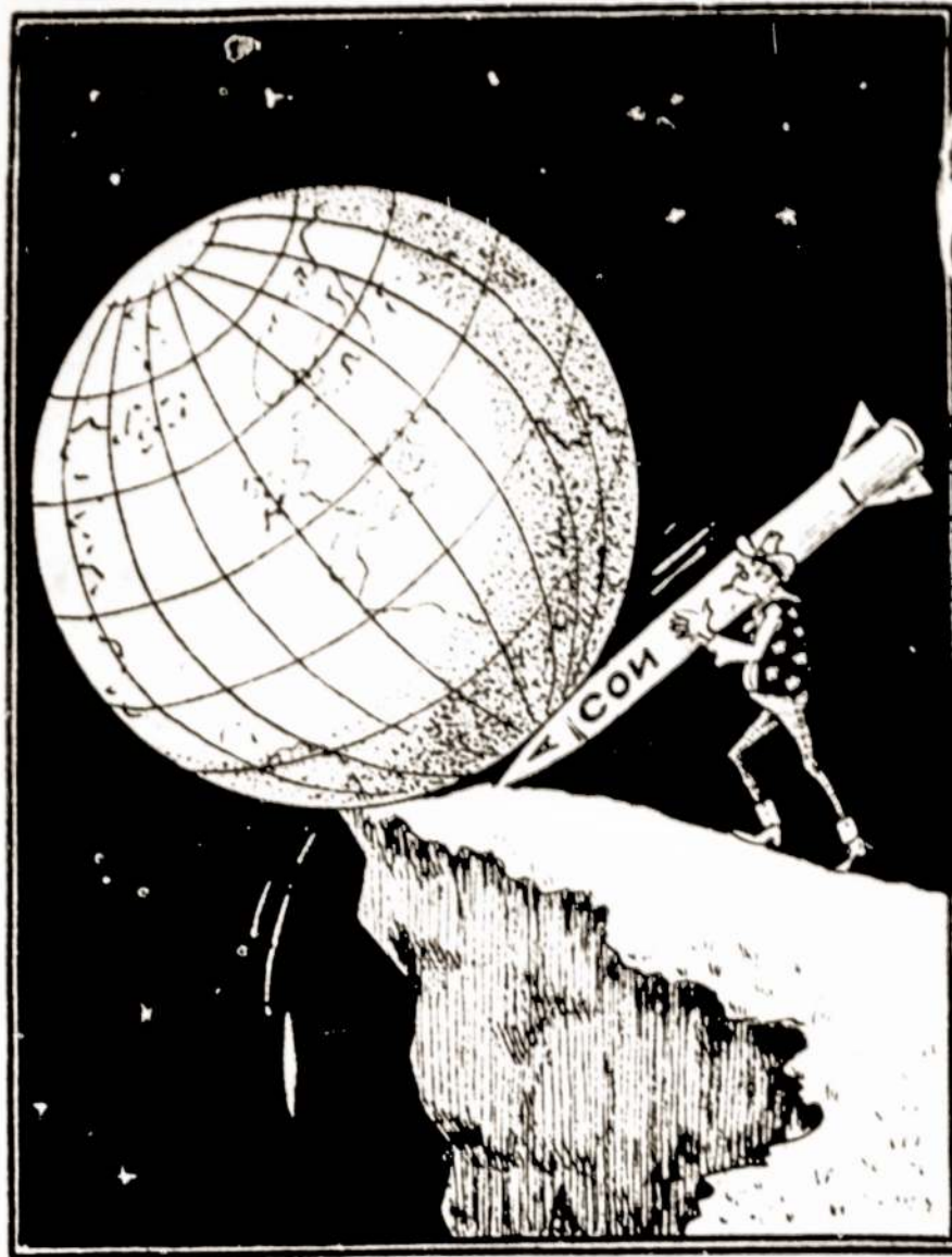
G. Stauber pieš., („Izvestijos“)