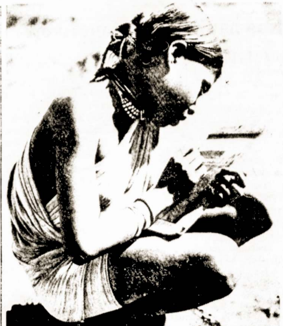
INDIJA. Mokausti rašyti.