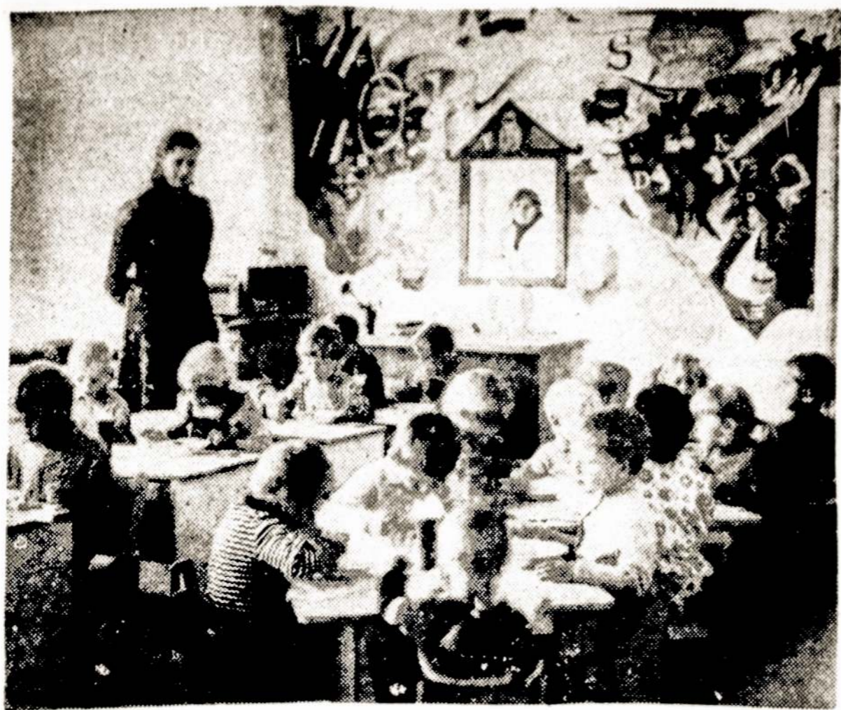
Visi Kretingos rajono Karolio Poželos kolūkio žemdirbių vaikai lanko ikimokyklinę įstaigą. Statybininkai ir meistrai papuošė vaikų darželį naujomis skulptūromis, piešiniais.