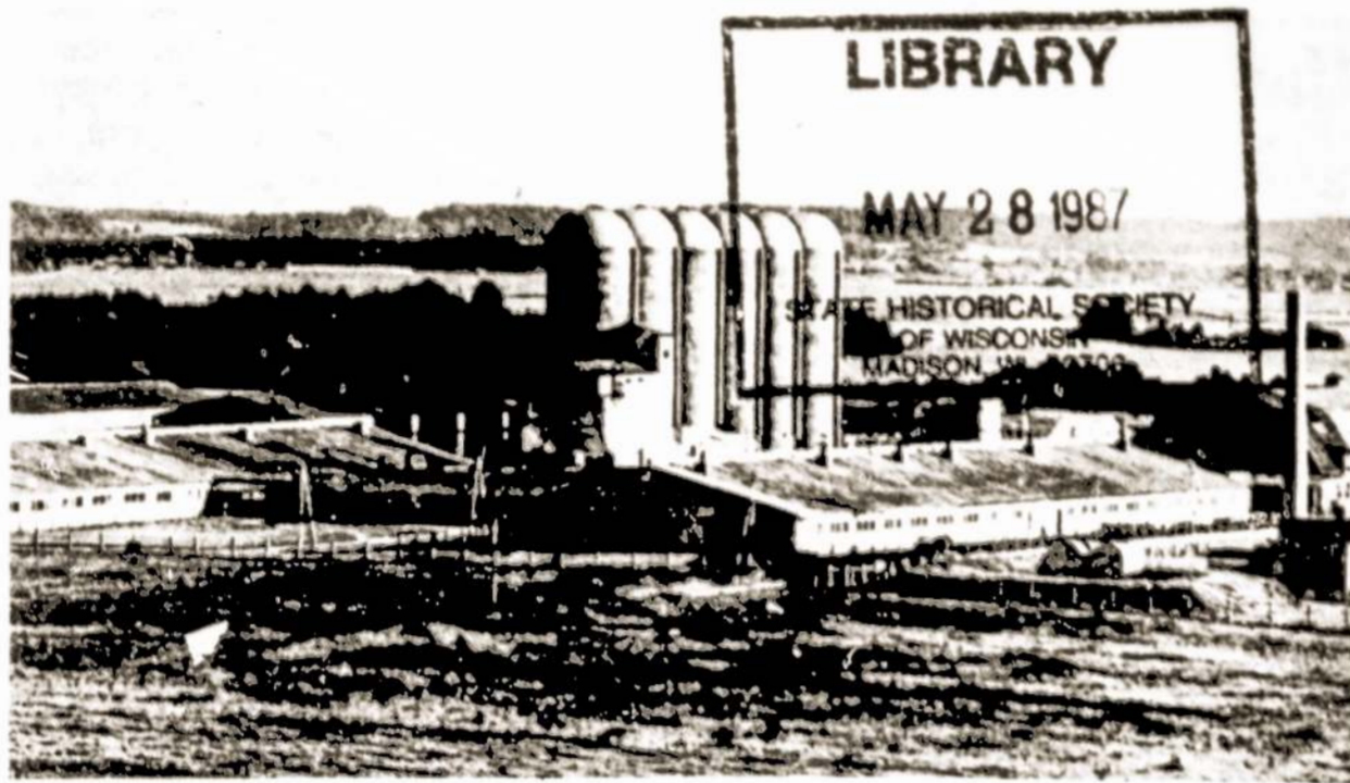
Kaišiadorių rajono Palomenės kolūkio 1,200 vietų pienininkystės kompleksas.

Nežiūrint kaip gelbėjo nusikaltėlių jo užtarėjai pabaltiečiai ir antitarybinių nuotakų visokiausio plauko dvikojai, netgi buvęs Baltųjų rūmų komunikacijų direktorius Patrick Buchanan, bet niekas iš to neišėjo.