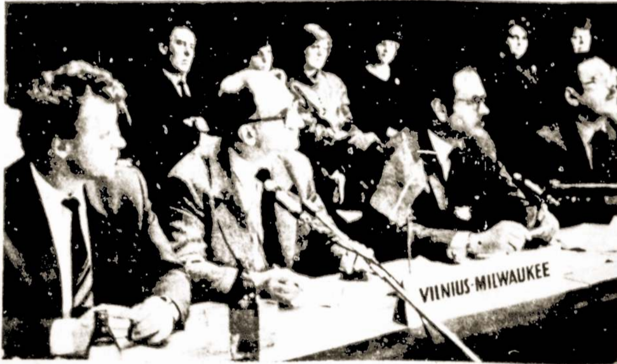
Prie Dialogo: Vilnius — Milwaukee.

Manau, kad jūsų laikraščio skaitytojams bus įdomu susipažinti su labai savotišku dialogu, kuriame neseniai teko dalyvauti. Tai buvo radijo pokalbis (teisingiau — netgi radijo diskusija) tarp Lietuvos sostinės ir Viskonsino valstijos Milwaukee miesto gyventojų.