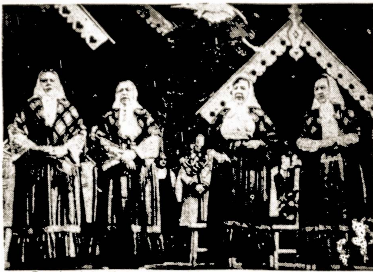
Daugiau kaip šimtas šeimų dalyvavo saviveiklinės kūrybos „Graži mano šeimynėlė“ respublikiniame konkurse. Devyniolika geriausių koncertavo baigiamojoje vakaronėje, surengtoje Kaune.

● Vilniuje, Rusų dramos teatre, spektaklis „Keturi lašai“ pirmą kartą pastatytas 1975 metais lapkričio 1 d. Ir štai šių metų balandžio 5 d. jis pastatytas 200-ąją kartą. Spektaklį taip pat pas save matė Tbilisio, Suchumio, Talino, Sverdlovsko ir kitų miestų žiūrovai.