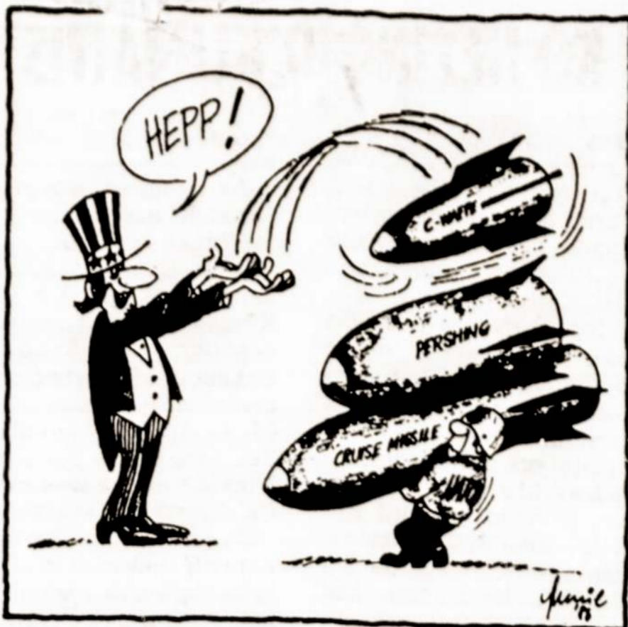
Amerikos „Perlingai“, sparnuotosios raketos, cheminis ginklas NATO šalis tampa nepakeliama našta. Pletynis iš laikraščio „Doičes algemaines zontagsblat“ (VFR). TASS-o fotokronika

Nuo masinės Lietuvos gyventojų emigracijos pradžios iki Pirmojo pasaulinio karo (1868—1914), tai yra maždaug per pusę šimtmečio, apie 90 procentų lietuvių imigrovo į JAV, kur tuo metu pragyvenimo ir darbo užmokesčio lygis buvo aukštesnis negu kituose užjūrio kraštuose. Tačiau apie dešimtadalis visų lietuvių emigrantų dėl lėšų stokos, sveikatos ar įvairių kitų suvaržymų negalėjo patekti į JAV. Todėl jie apsigyven-