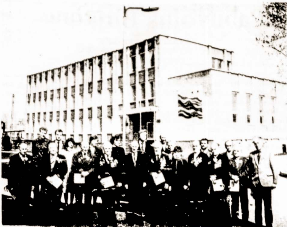
Kupiškio statybinių medžiagų gamyklos jaunimas su darbo ir karo veteranais.