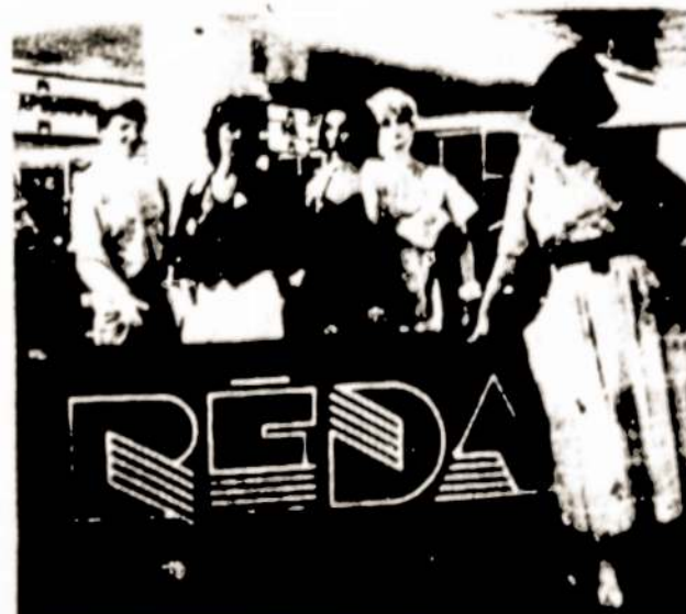
Kauno firminėje parduotuvėje „Rėda“.