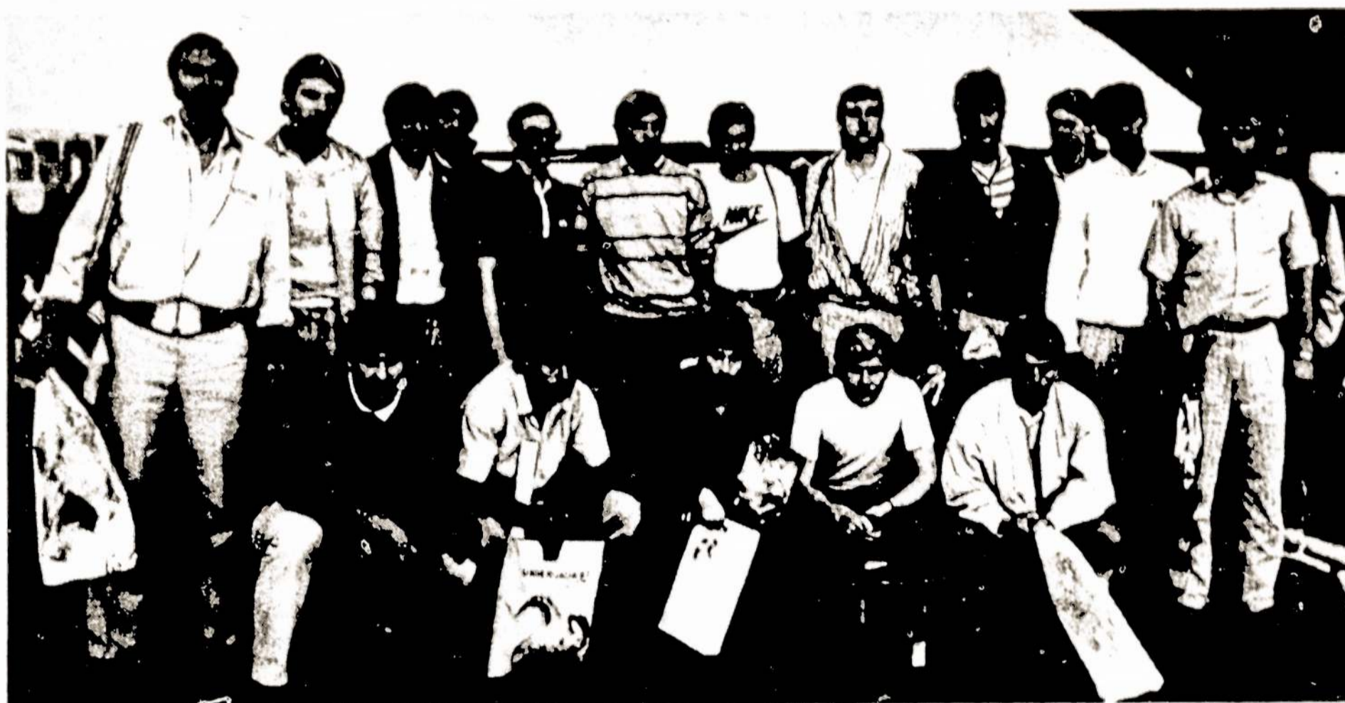
Vilniaus žalgiriečiai — pasaulinių studentų žaidynių nugalėtojai.

VILNIAUS „ŽALGIRIO“ FUTBOLININKAI — PASAULINĖS UNIVERSIADOS ČEMPIONAI