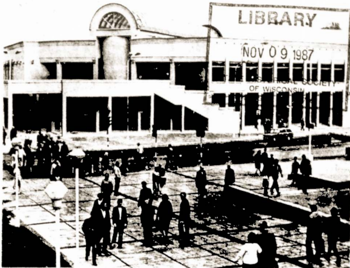
Šiaulių miesto kolūkinėje turgavietėje atidarytas originalios konstrukcijos prekybos paviljonas. Pirmajame aukšte įsikūrė pramoninių prekių parduotuvė ir valgykla. Antras aukštas skirtas maisto produktų prekybai. Projekto autorius — architektas R. Jurėnas.

Pajuokavo ar nepajuokavo, bet jeigu manevruose iš 350 šarvuotųjų nė vienas nesugedo, tai reiškia, kad ir kitos tarybinių mechanikų sukurtosios mašinos nelengvai genda. O antitarybininkai kiek prisipa-