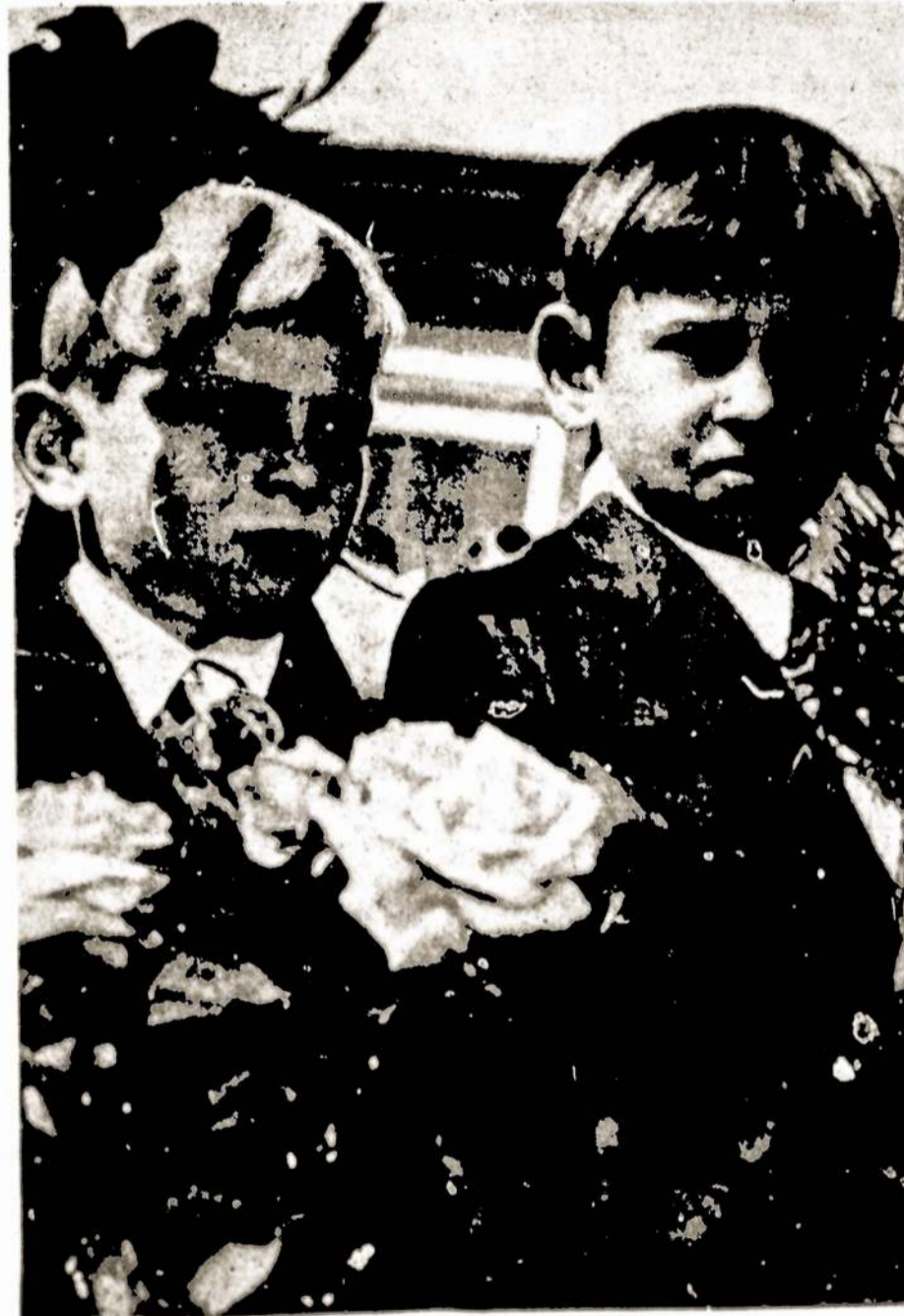
Lietuvoje bendrojo lavinimo mokyklose mokosi daugiau kaip 518 tūkstančių moksleivių.

Orkestras rengiasi išvykti į pasaulinio garso tarptautinius muzikos festivalius Zalburge (Austrija) ir Ansbache (Vokietijos FR).