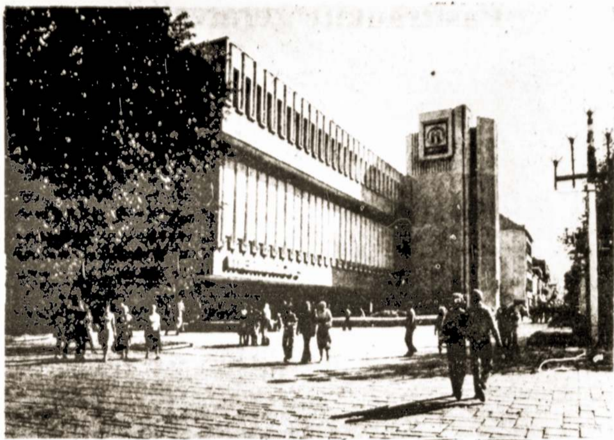
Kauno universalinė parduotuvė "Merkurijus".