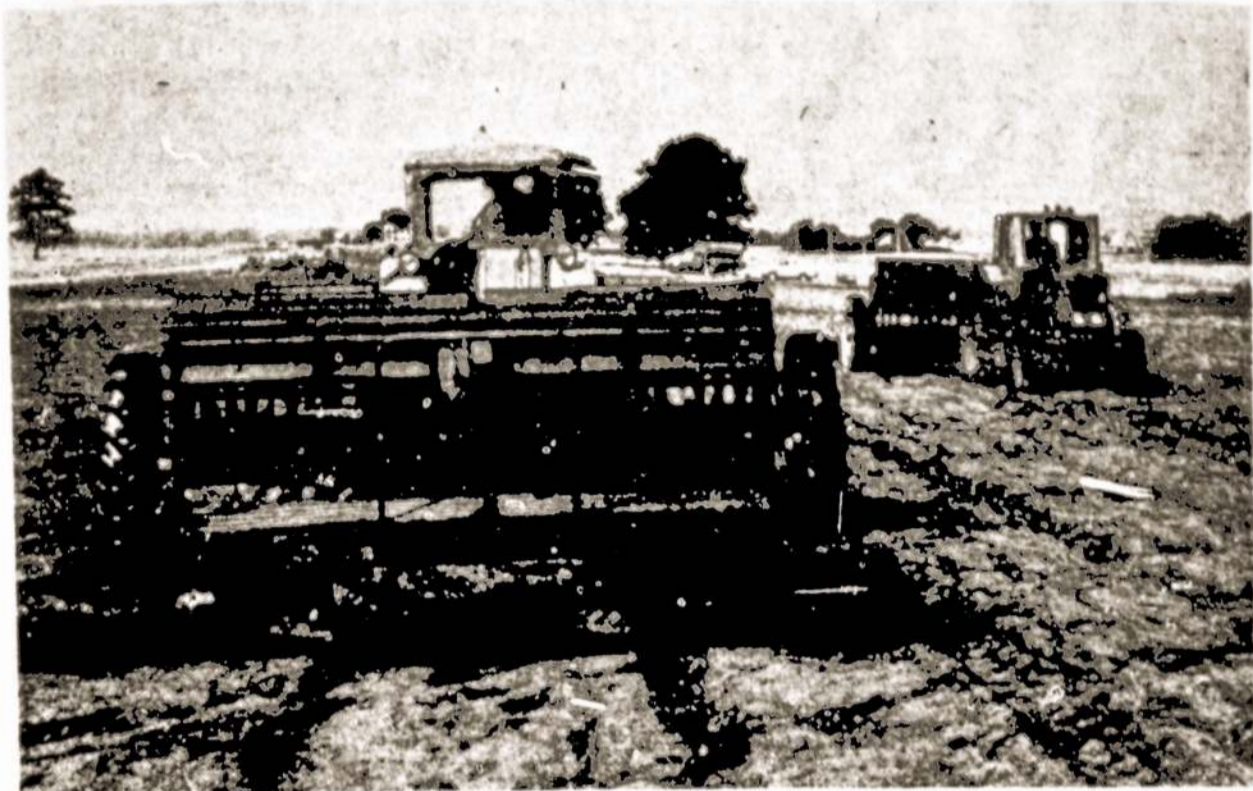
Silutės tarybinio ūkio-technikumo sėjamosios laukuose. Jomis per 8-9 dienas galima lengvai apseiti 500 ha.