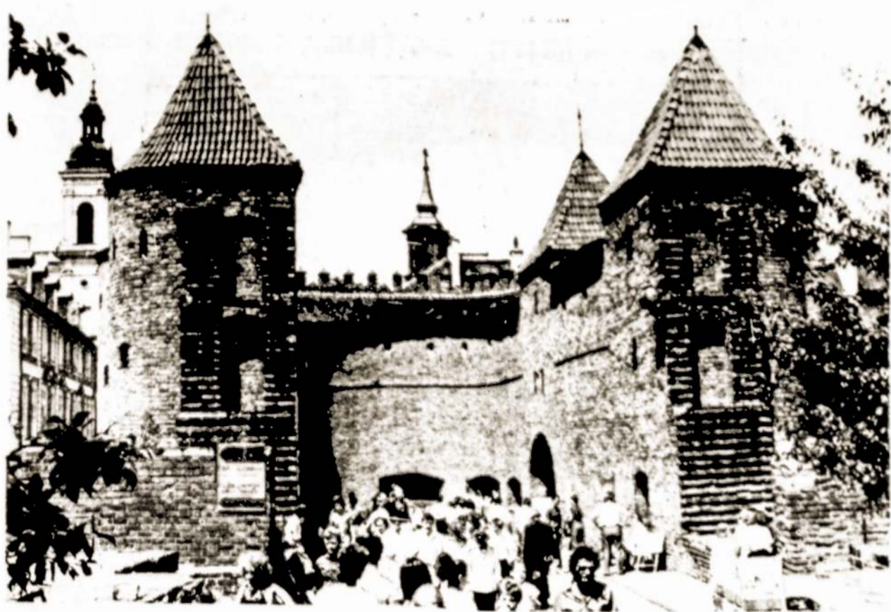
Lenkijos Senasis Baebakans, Varšuvos architektūrinis paminklas. Antrojo pasaulinio karo metu buvo visiškai sugriautas. Pokario metais, pagal išlikusius brėžinius, ši tvirtovė atstatyta. Vasaros metu čia vyksta įvairūs renginiai, organizuojamos dailės parodos.