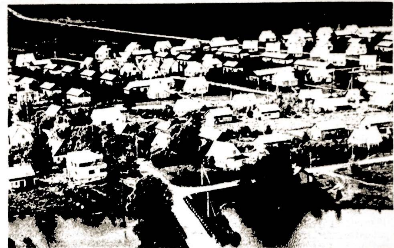
Panevėžio rajono Ąriškių kolūkio gyvenvietė.