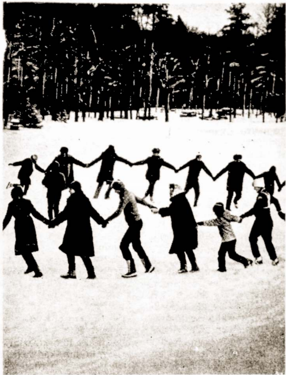
Kai iškrito pirmasis sniegas