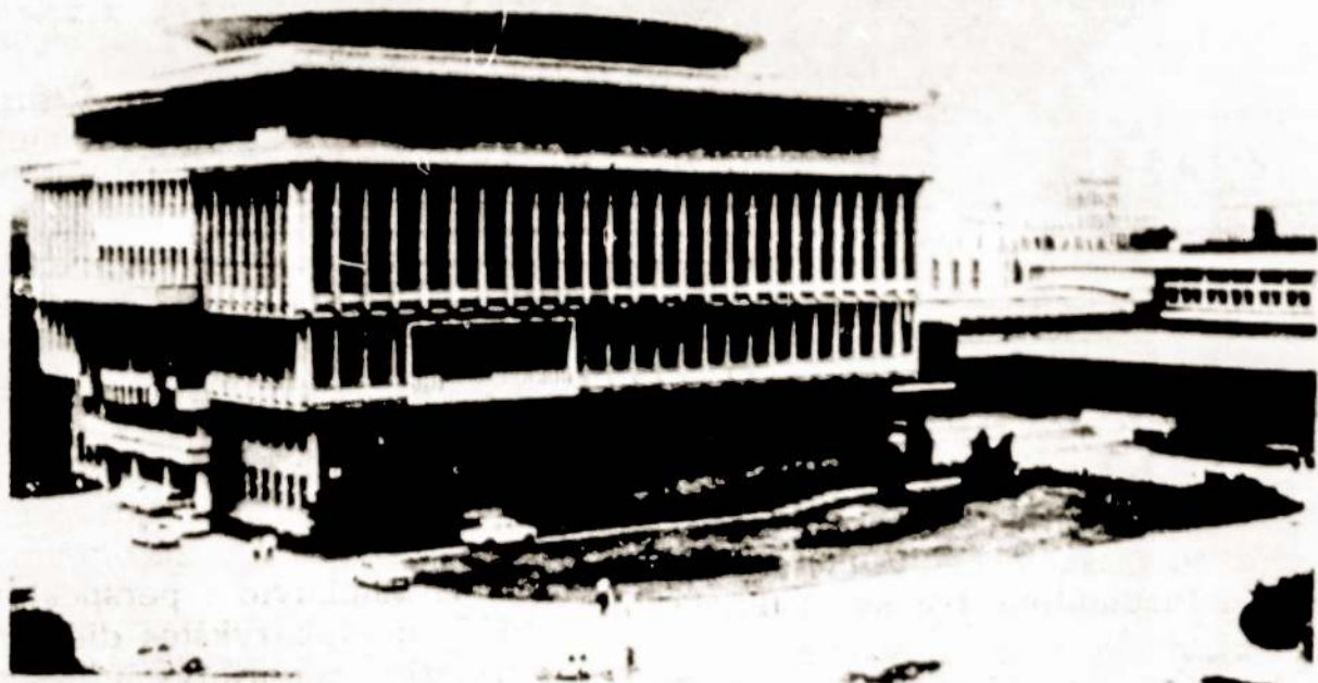
Rumunijos Socialistinės Respublikos sostinės Bukarešto centre.