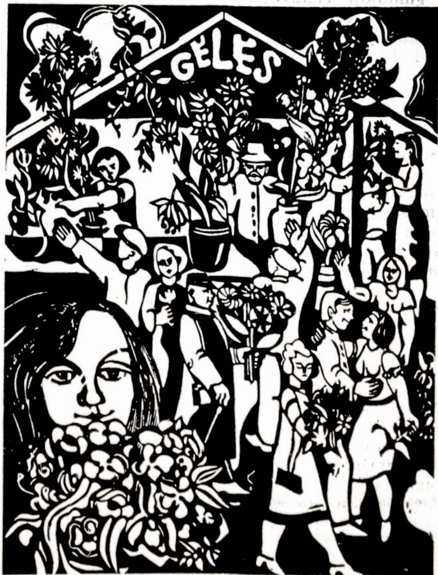
Dailininko Vaclovo Zigmanto [Siauliai] lino raižinys.

mūsų tautos krantus, abi jos dalis, kamieną ir šakas — gimtąjį kraštą Lietuvą su užsienio lietuviomis. Ta jungtis neišardoma. Mes visada su Jumis. Sveikatos, tvirtybės, energijos. Geriausi linkėjimai kitiems draugams ir, žinoma, mielajai Anai.