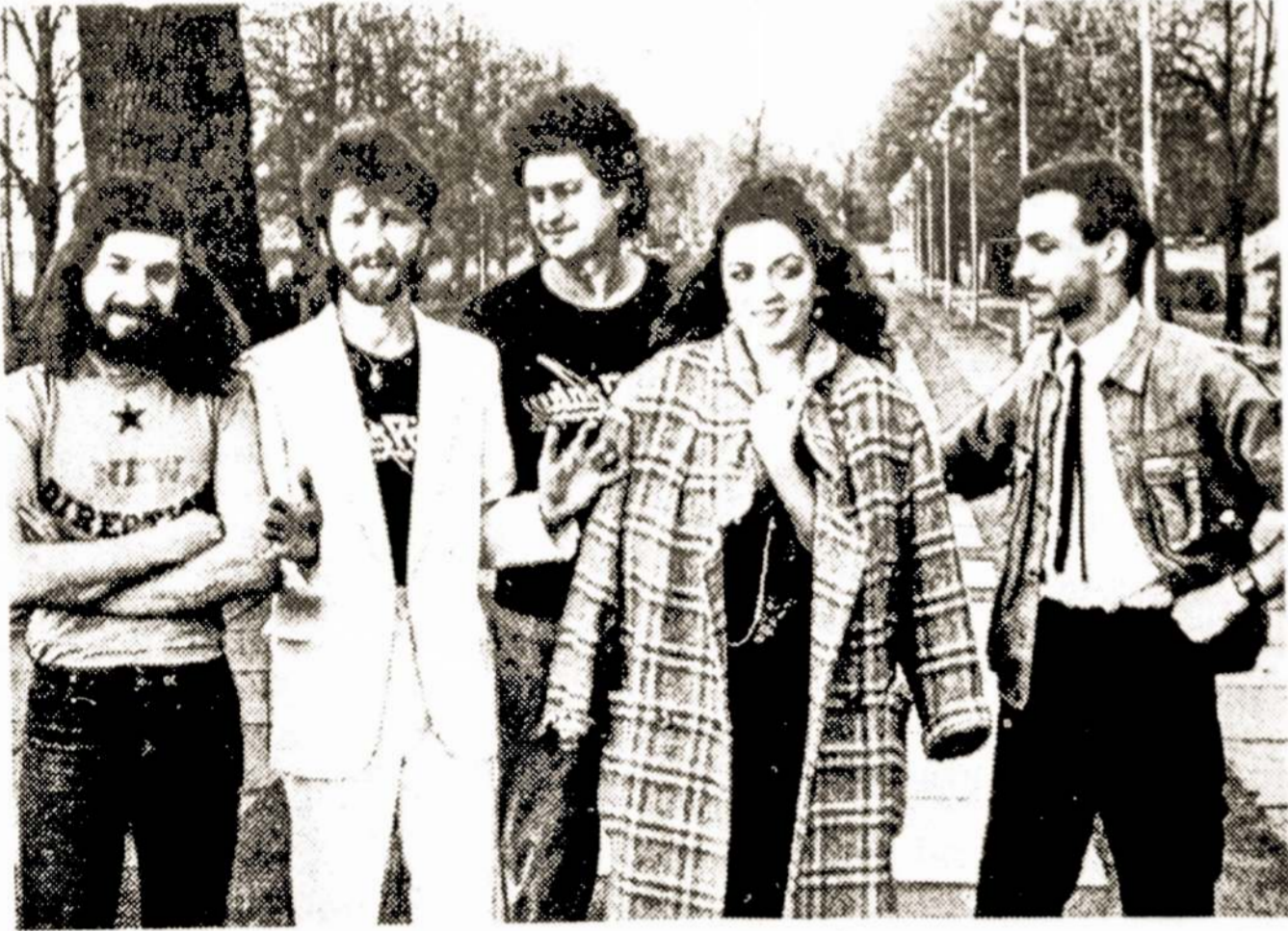
Vilniaus sporto rūmuose pirmą kartą koncertavo roko grupė „Kalvė“ iš Alytaus.