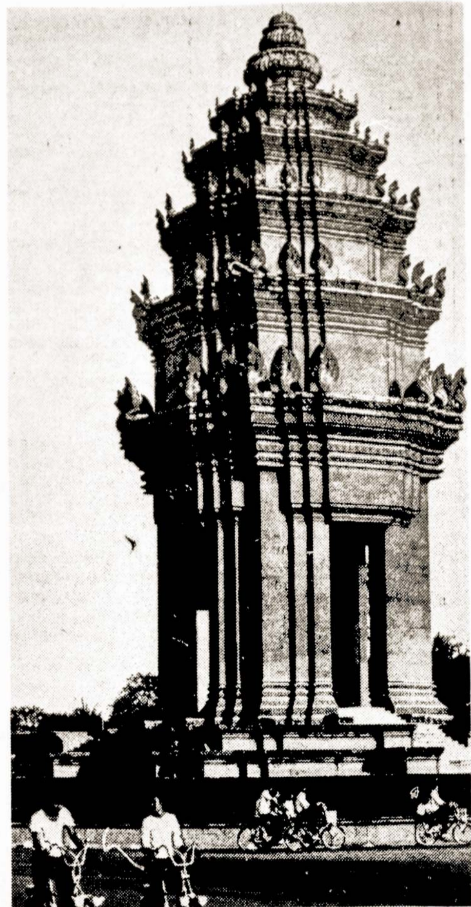
Monumentas žuvusiems revoliucijos kovotojams atminti Kampano sostinės Pnompento centre.