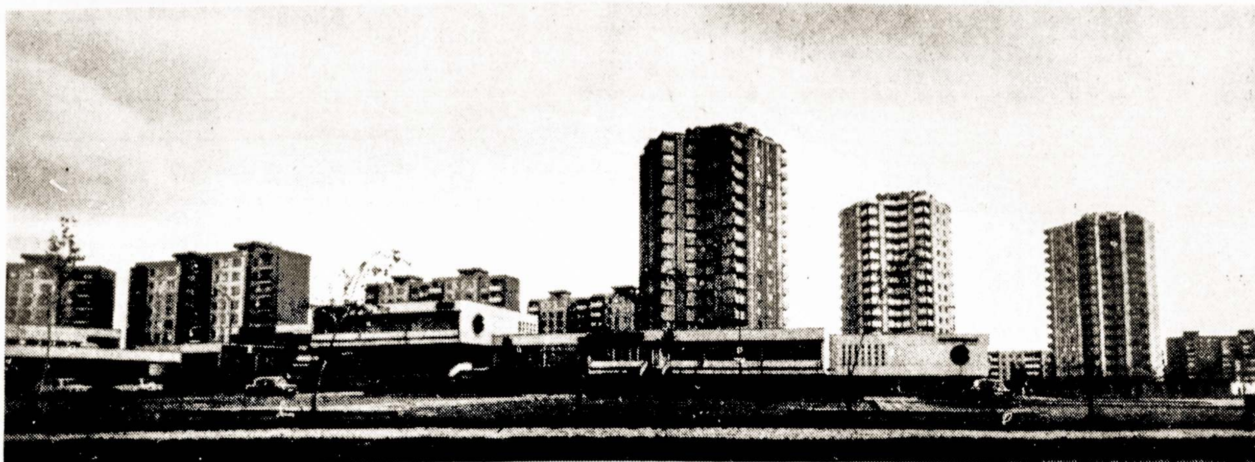
Kalnėčių gyvenamasis rajonas.