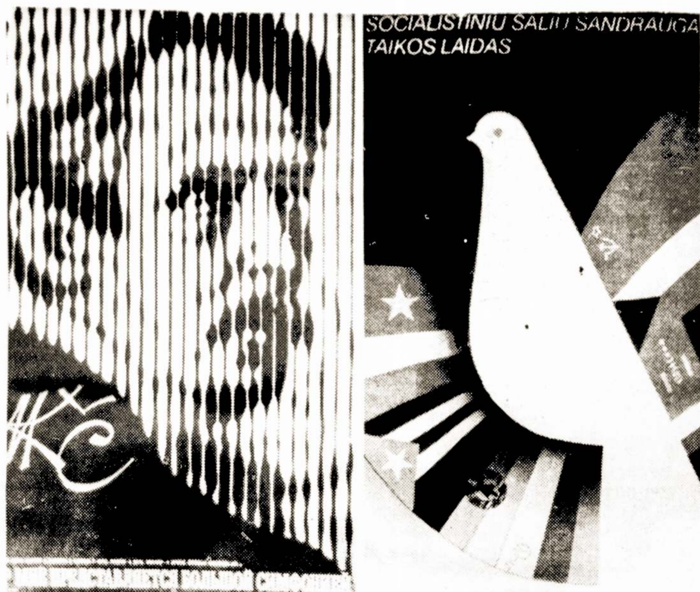
NUOTRAUKOSE: M. Znamerovskio plakatų reprodukcijos.