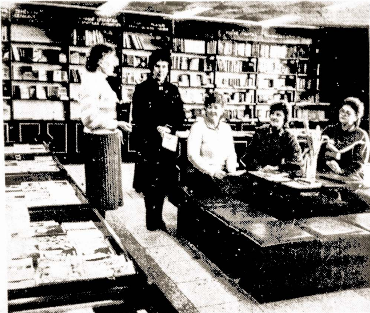
Šilutėje prieš 120 metų buvo įkurtas pirmasis knygynas. Pernai rajoninis knygynas pardavė knygų už 307 tūkstančius rublių.

Laikraščio administracinė Direktojų Taryba laiškė skaitytojams ragina pereiti skaityti „Laisvės“ brolišką laikraštį „Vilni“. Tenka laukti, kad laisviečiai ir vilniečiai skaitytojai suglaudę eiles garan-