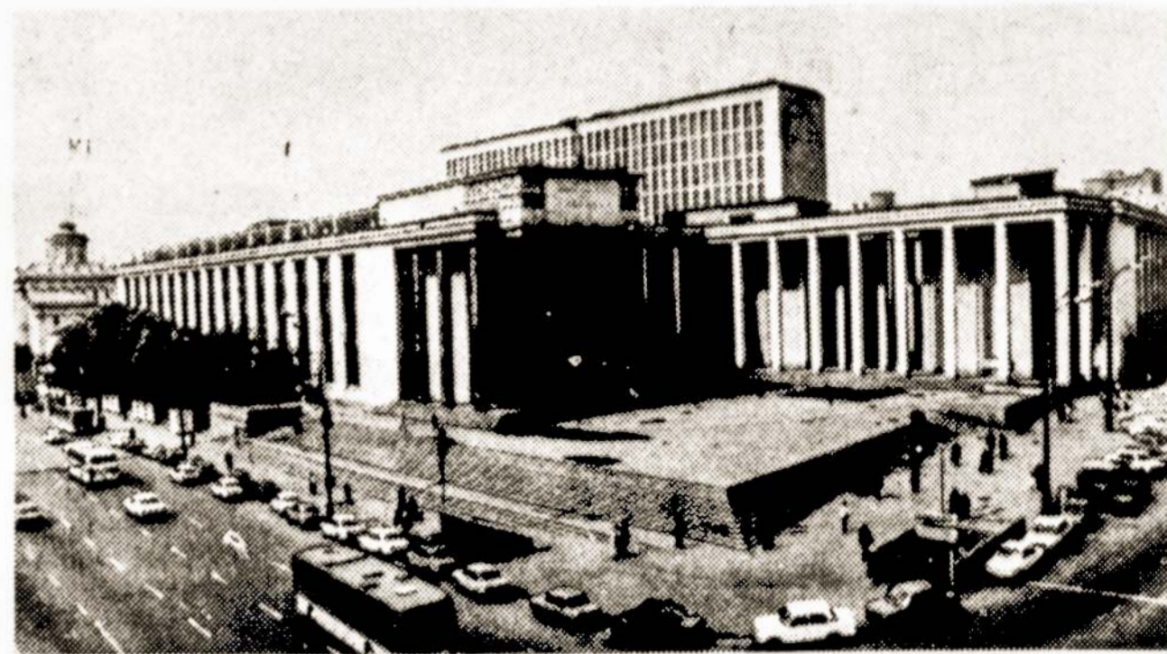
Valstybinės V. Lenino bibliotekos rūmai Maskvoje. Biblioteka viena didžiausių pasaulyje. Jos fonduose beveik 30 milijonų knygų, žurnalų, laikraščių komplektų, žemėlapių, įvairių dokumentų daugiau kaip 200 pasaulio kalbomis.

Kitas įdomus klausimas: kodėl neminima, iš ko ir kaip gyvena ši kūrėjų „armija-minia“? Ogi didžia dalimi iš... valstybės kišenės, iš jos dotacijų pačioms įvairiausiomis kultūros įstaigoms. Manau, nereikia būti Einšteinu, norint suprasti, kad ir Dainų šventės už kelis rublius nesuruošti, ir etnografinių ekspedicijų nesurengsi, ir tie patys dirigentai nekrenta nuo medžių kaip prinokę obolai — juos ruošia VALSTYBĖ. Ta pati