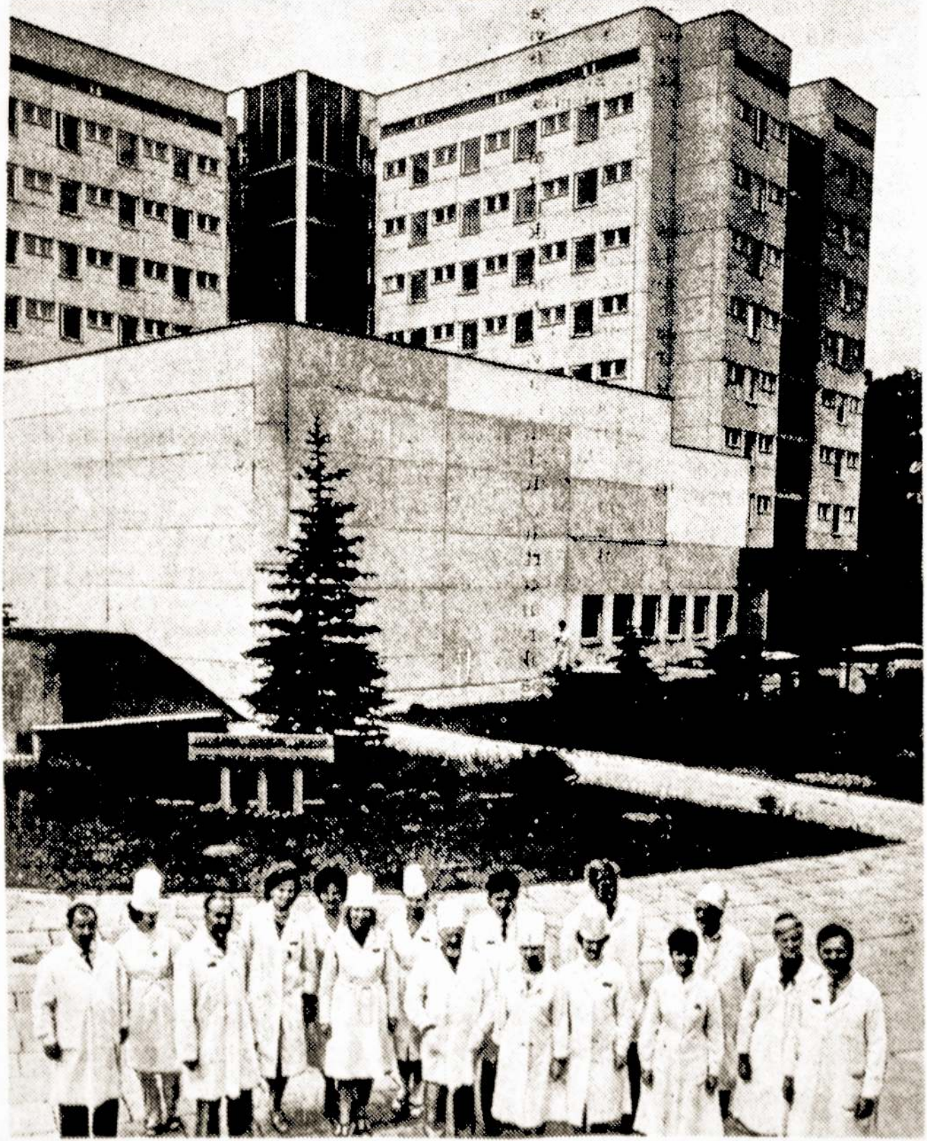
Panevėžio respublikinė ligoninė ir jos gydytojai.

[Nukelta į 7 pusl.] Vilnius, 1988 m. liepos 7 d.