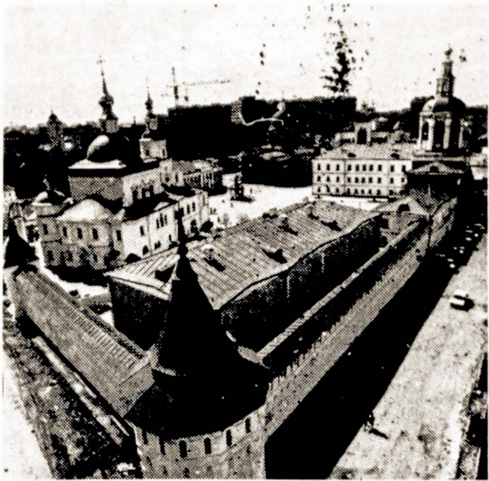
Galima sakyti, antrąją jaunystę pergyvena Maskvos švento Danijilo vienuolynas, įkurtas prieš septynis šimtus metų Aleksando Nevskio jaunesniojo sūnaus Daniljo. Unikali rusų architektūros paminklą 1983-aisiais metais tarybinė vyriausybė perdavė Rusijos pravoslavų cerkvei. Ruošiantis pažymėti krikščionybės įvedimo Rusijoje tūkstantmetį, švento Daniljo vienuolyno kompleksas restauruotas, jame įsikūrė Rusijos pravoslavų cerkvės administracinis centras. Jubiliejinį iškilmių metu vienuolyno bažnyčioje vyko iškilmingos pamaldos.

Maskvos švento Daniljo vienuolynas.