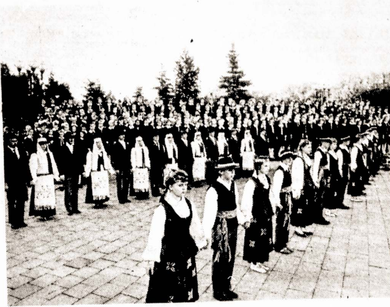
Dainų šventės Panevėžyje valdas.

• • • Didžiojoje komercinėje spaudoje beveik nieko nebuvo rašyta ir vis dar nėra rašoma apie įvykusią New Yorke birželio 11 dieną taikos demonstraciją, pareiškusią Amerikos liaudies troškimą pasaulyje taikos, ir žurnalistai yra žmonių protų inžinieriai. Architektai inži-