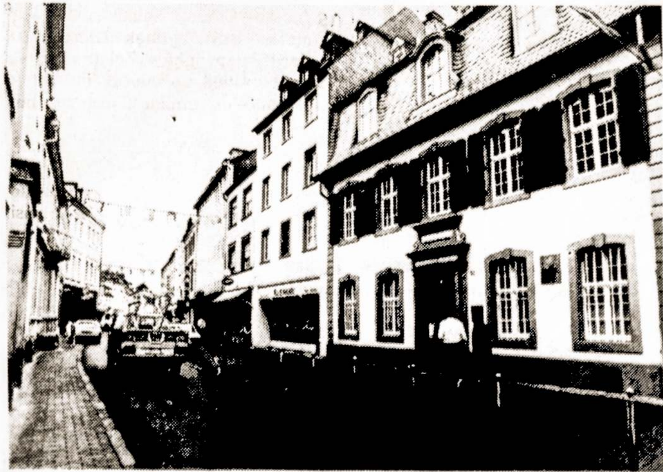
Vakarų Vokietijoje Karl Markso namas-muziejus. Šiame muziejuje surinkta apie 2,000 dokumentų, nuotraukų, kitų eksponatų.