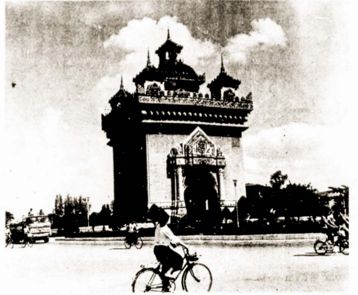
Nuotraukoje triumfo arba „Anusavara“ Laoso Liaudies Demokratinės Respublikos sostinės Vientiano centre.