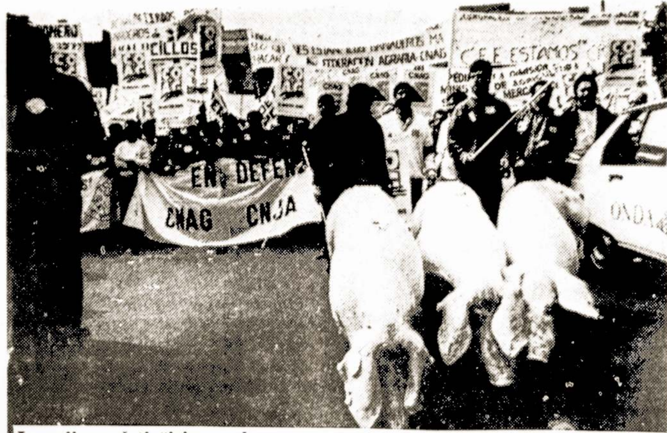
Ispanijos valstiečiai pareškė protestą prieš Europos ekonominės bendrijos politiką jų atžvilgiu, pagal kurią Ispaniją importuoja daug kiaulienos. Todėl Ispanijos valstiečiams, auginantiems kiaules, grėsia visiškas nusigyvenimas.