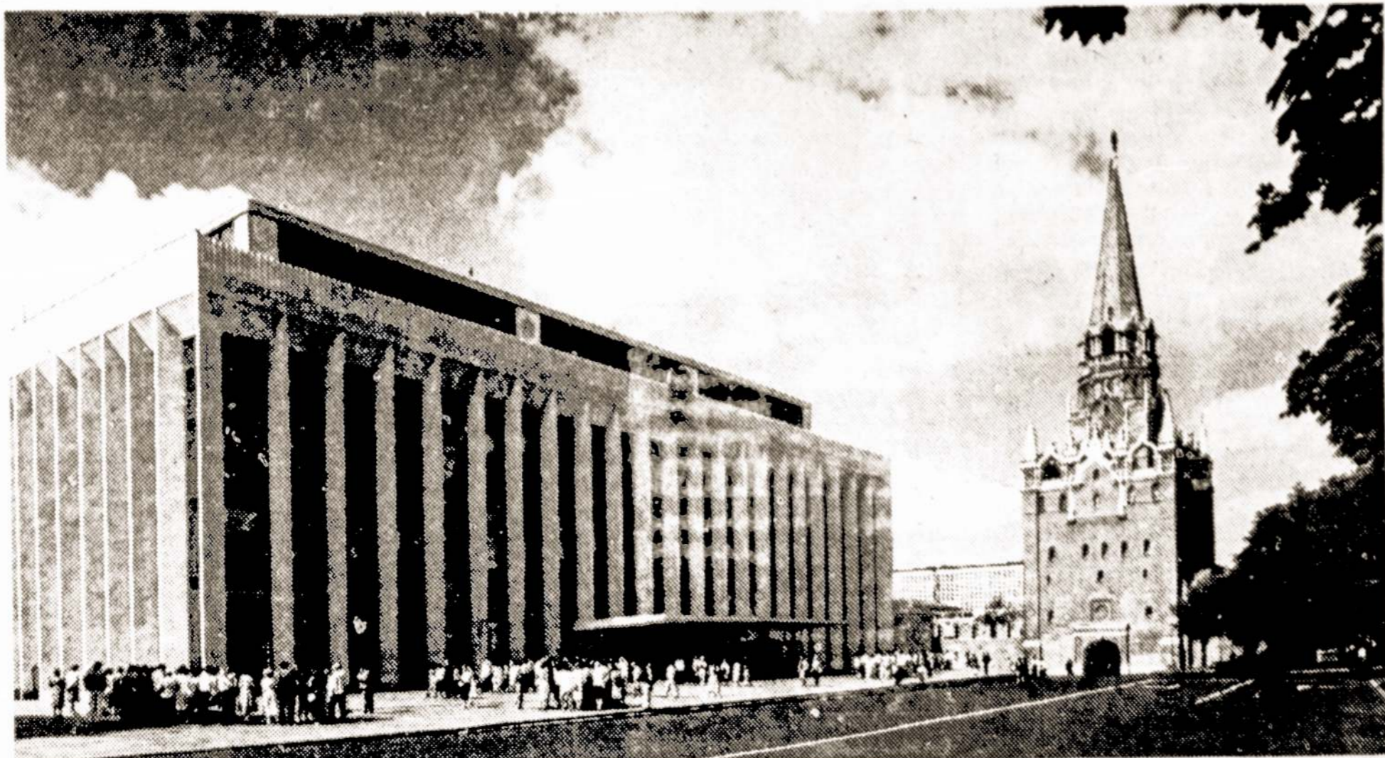
MASKVA. Kremliaus Suvaživimų rūmai.