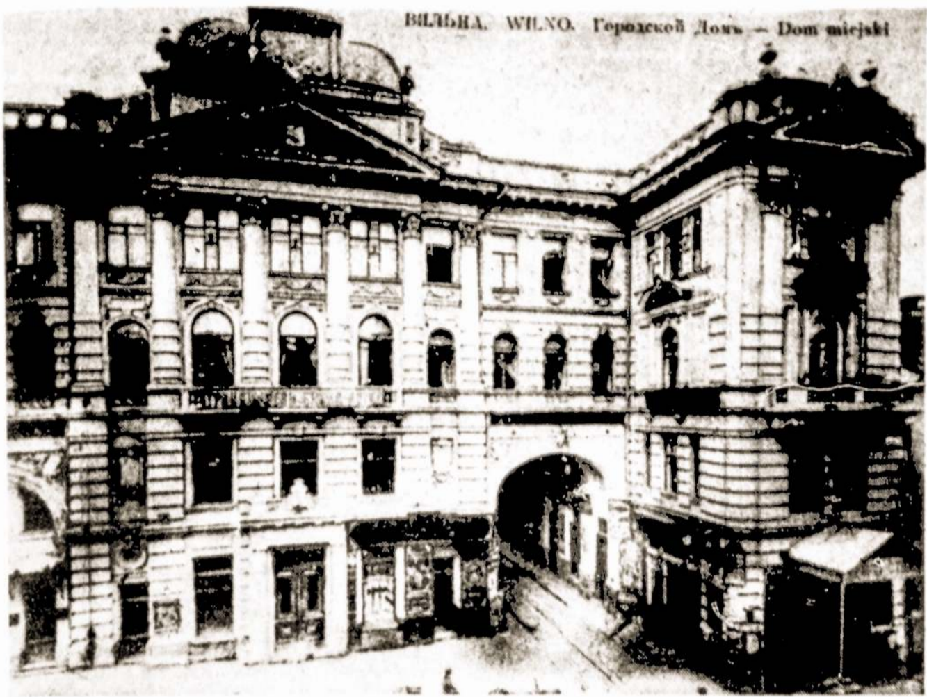
Taip amžiaus pradžioje atrodė miesto rūmai [dabar Valstybinė filharmonija]. Istorinėmis 1918-ųjų pabaigos dienomis jų durys plačiai atsitvėrė Vilniaus darbo žmonėms ir, komunistų pasiūlymu, buvo Vilniuje paskelbta Tarybė valdžia.