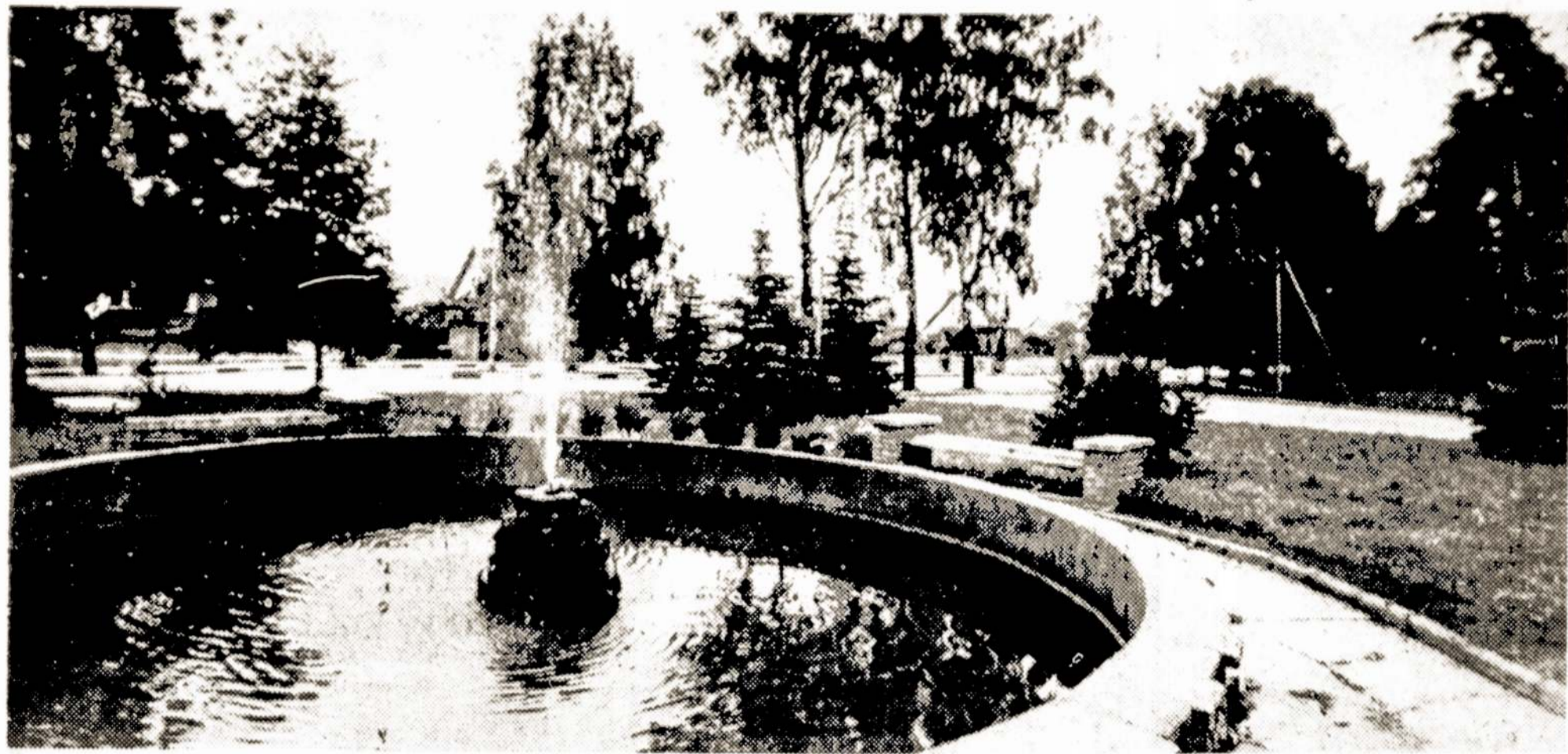
Plaučiškės — Pakruojo rajono „Ažuolo“ kolūkio centrinė gyvenvietė.