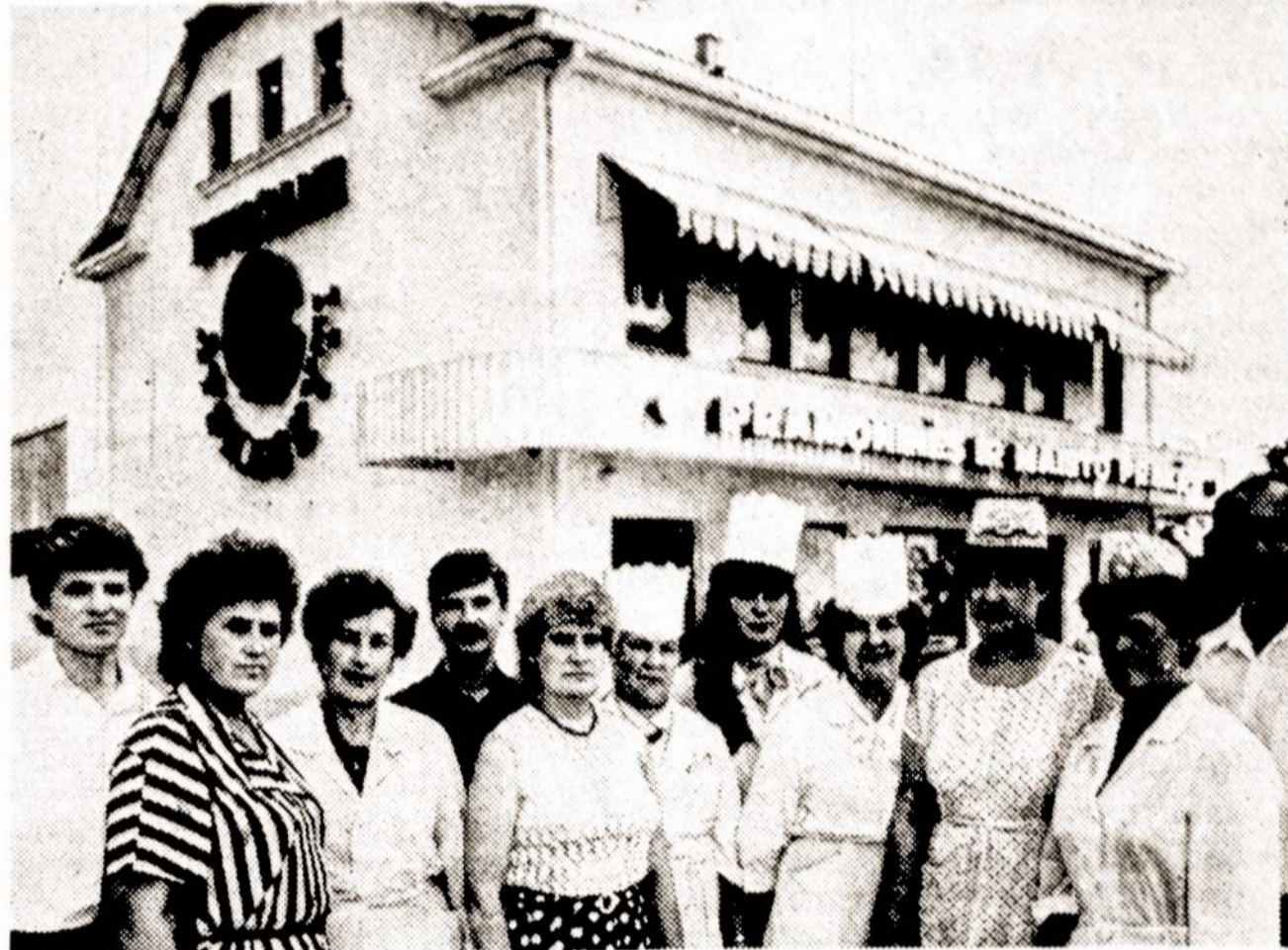
Berčiūnų prekybos centro kolektyvas.