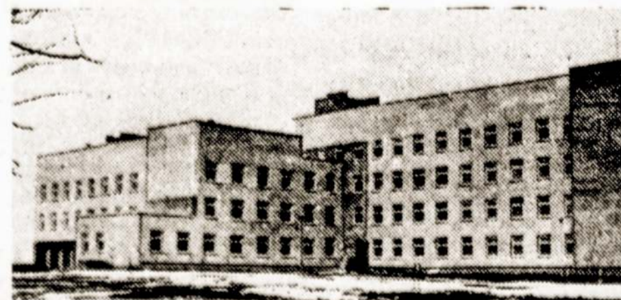
Naujųjų gimdymo namų kompleksas Šiauliuose.