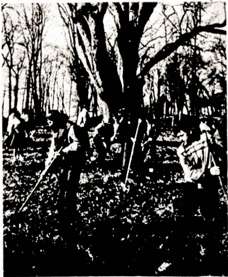
Siemet Lietuvoje Pavasario šventėje darbuosi apie 300 plateliškių. Vieni dirbo laukuose, kiti tvarkė aplinką. Nuotraukoje vidurinės mokyklos moksleiviai valo Platelių parką.