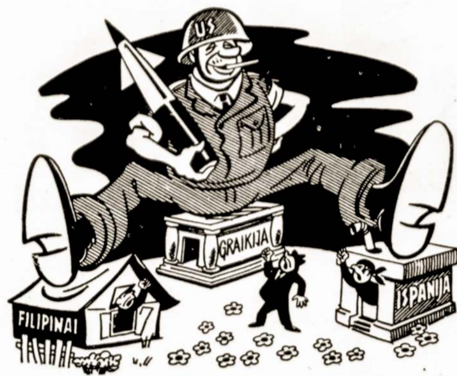
Juozas Bulvydo piešinys.