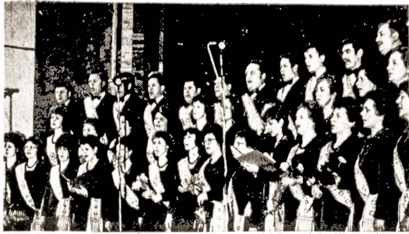
Kiekvienas Raseinių "Satrijos" siuvimo gamybinio susivienijimo mišraus choro koncertas dainininkams, jų šeimos nariams, visiems raseiniškiams yra šventė. Chore apie penkiasdešimtis raseiniškių dainos entuziastų. Nuo 1960 metų "Satrijos" choras dalyvauja respublikinėse ir zoninėse dainų šventėse.