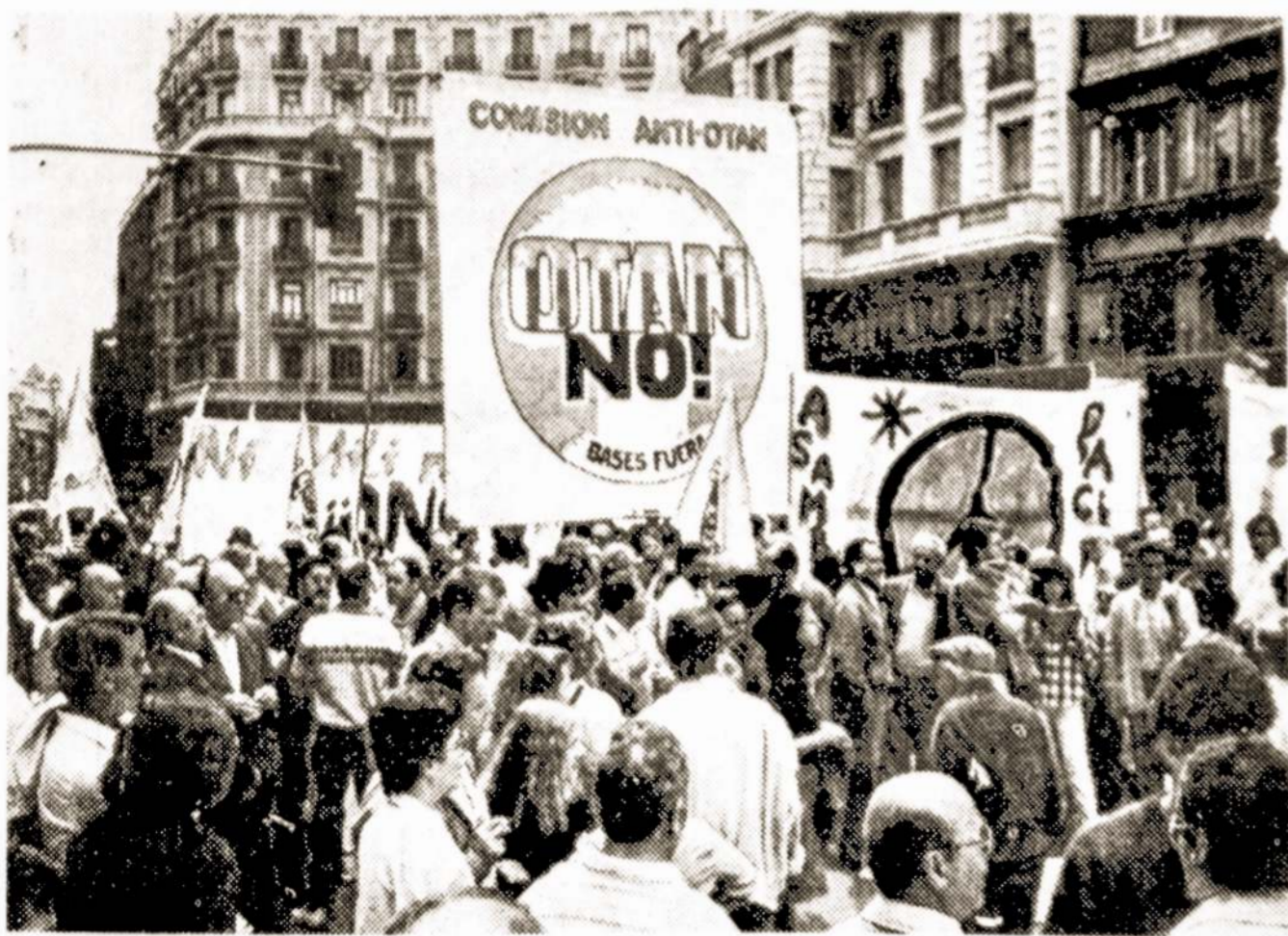
Viena iš daugelio demonstracijų Ispanijoje, reikalaujanti iš vyriausybės, kad šalis išstotų iš NATO ir kad Ispanijoje būtų panaikinti JAV kariniai objektai.