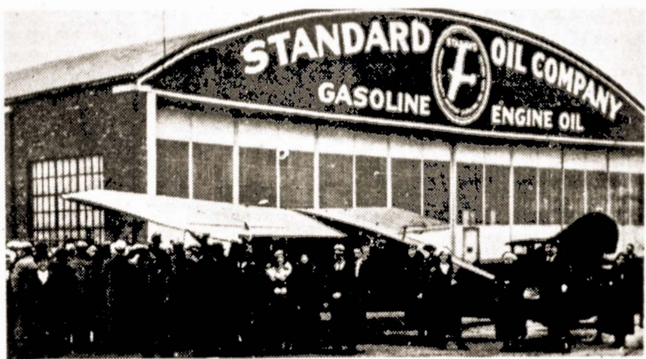
Ne vienas chicagietis lietuvis atsimena 1933 gegužės 7 dieną, kai išlėdėjo Dariu ir Girėna į skrydį per Atlantą. Nuotraukoje: Kai vyko su lakūnais atsiveikimas Chicagoje.