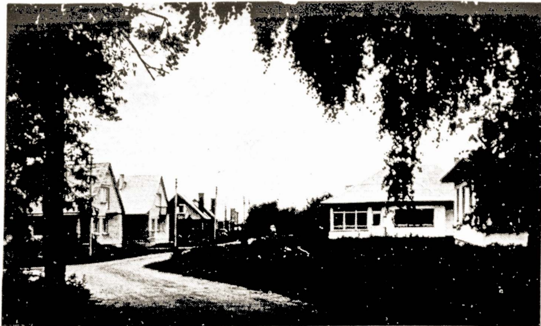
Pastrėvis — Trakų rajono M. Melnikaitės kolūkio centrinė gyvenvietė.