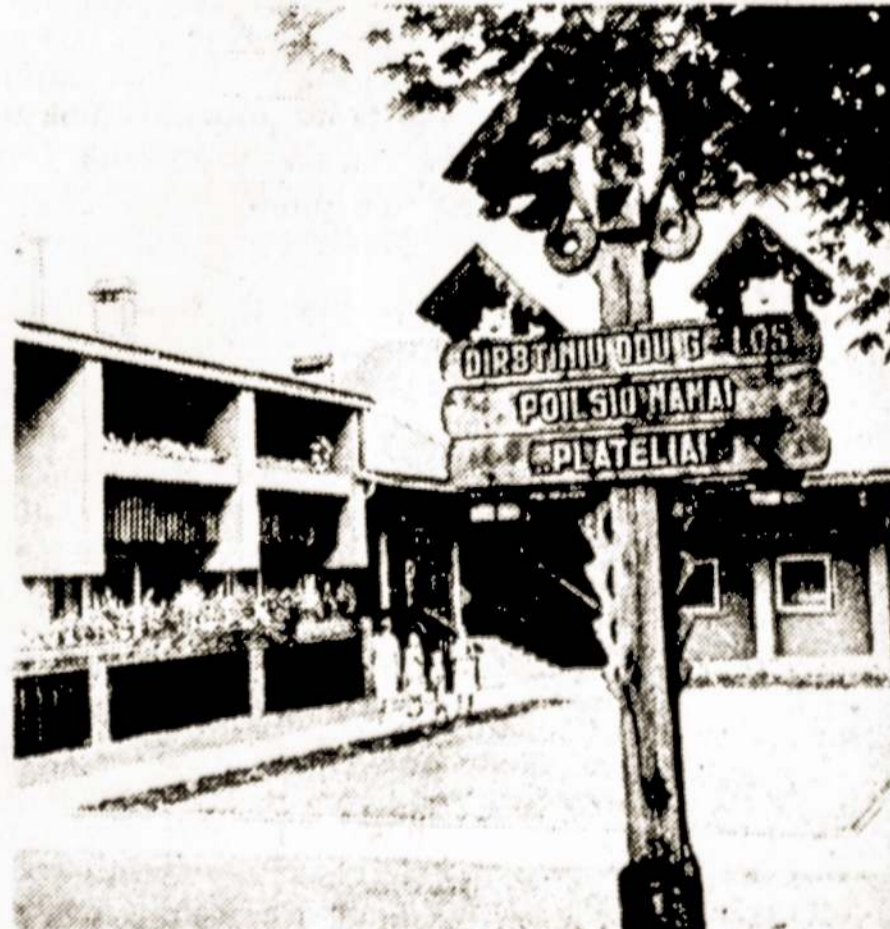
Plungės dirbtinių odų gamyklos dirbantieji atostogų metu gali naudotis keliais aplais į Palangą, Nidą, Druskininkus, norintys gali išsėtis gamyklos profiliaktoriuje arba savoje poilsivietėje prie Platelių ežero.