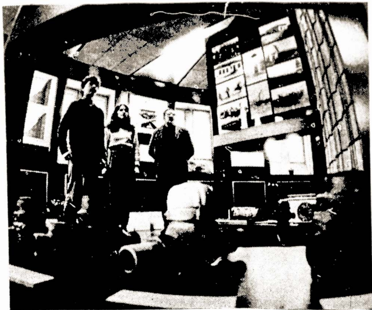
Visuomeninis Šiaulių vandentiekio muziejus.