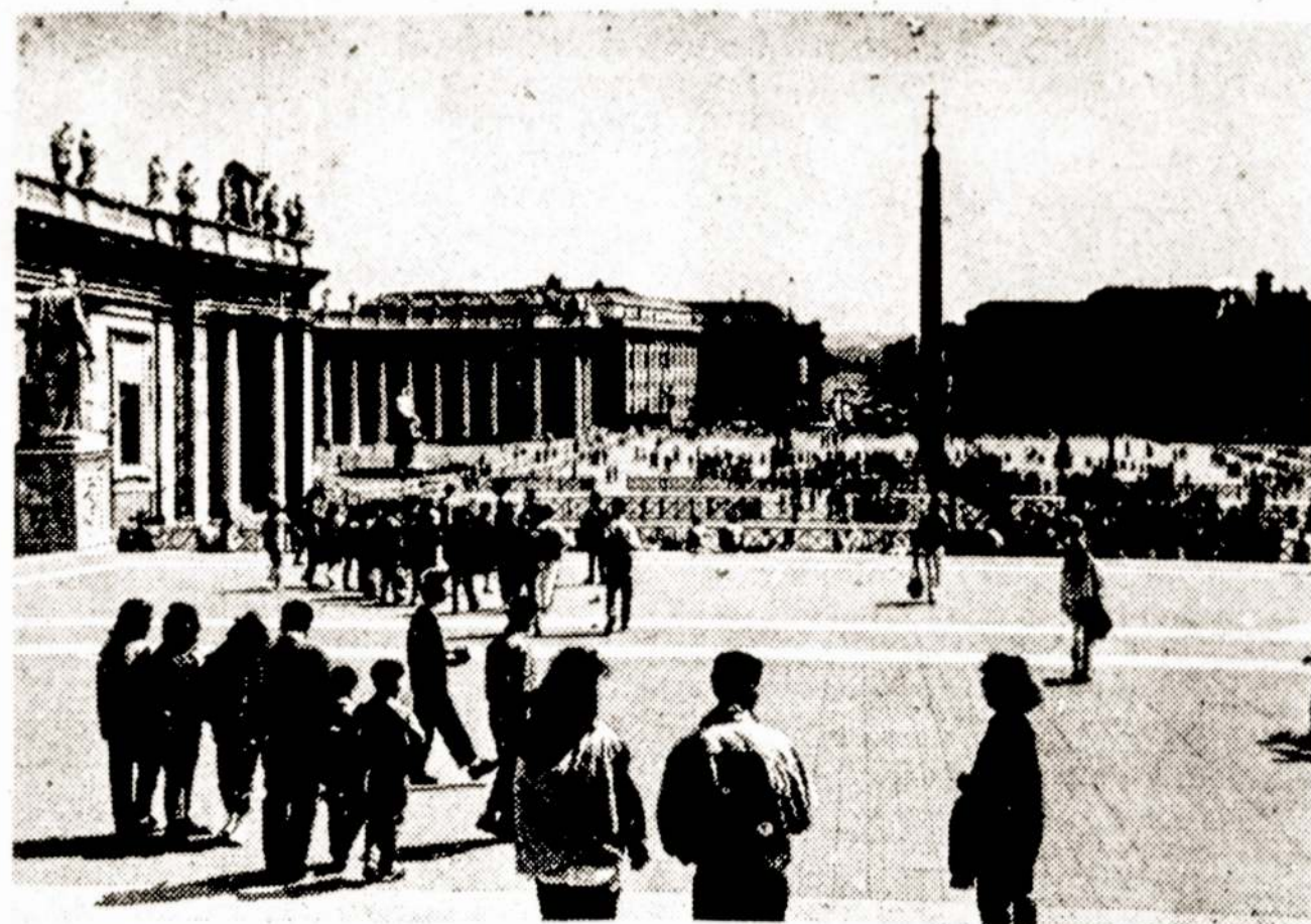
Nuotraukoje: Sventojo Petro aikštė.