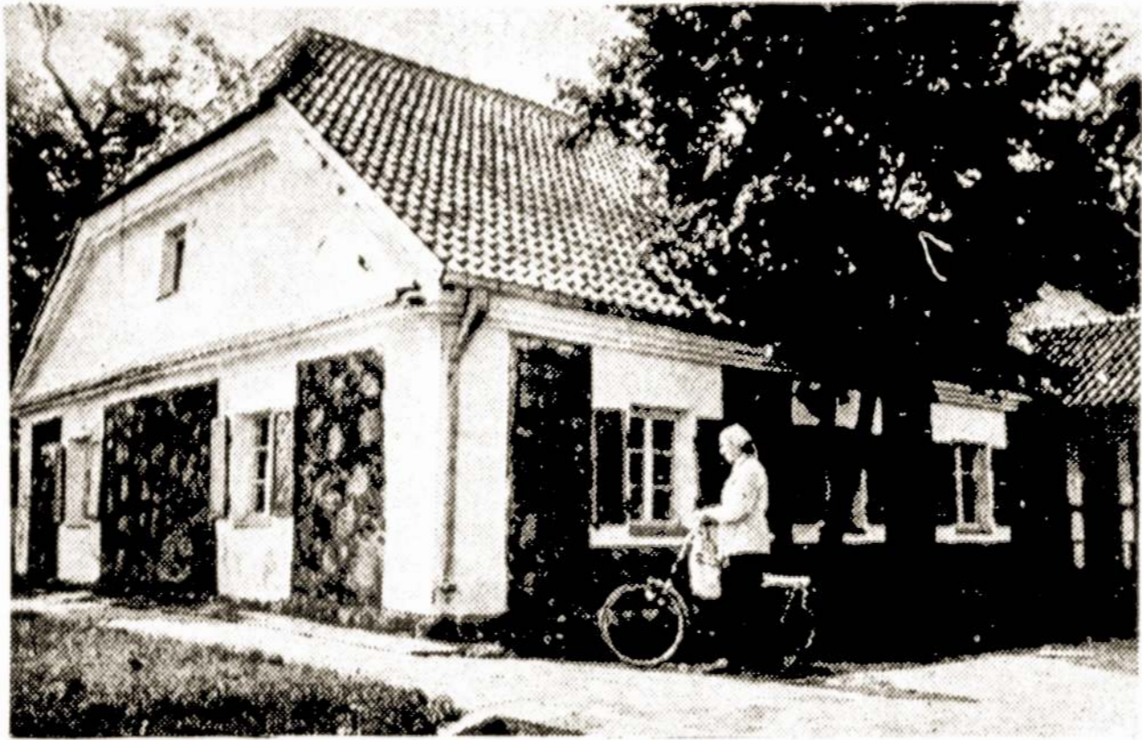
Siaulių rajono kolūkio "Už taiką" žmonės dvylika metų bendrauja su LTSR rašytojų sąjunga. Kolūkis yra įsteigęs poeto Zigmo Gėlės-Gaidamavičiaus premiją už geriausią metų poetinį debiutą. Restauruotame poeto gimtajame name Naisiuose įsikūrė rajono literatūros muziejus.

A. Dilio nuotraukoje: Siaulių rajono literatūros muziejus Naisiuose.