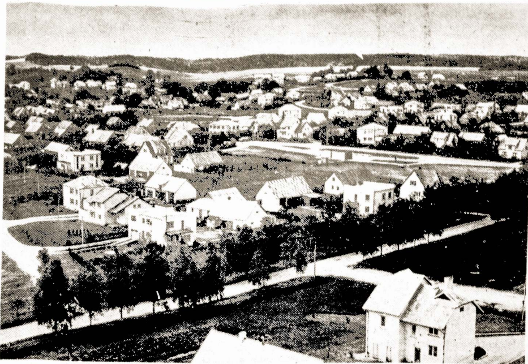
Plateliai — centrinė Plungės rajono to paties pavadinimo kolūkio gyvenvietė.

Sunku pasakyti kiek Amerikoje yra branduolinėms bomboms urano