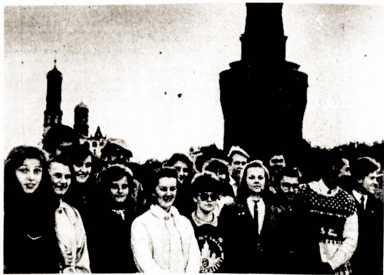
Grupė Maskvoje besimokančio Lietuvos jaunimo Raudonojoje aikštėje.