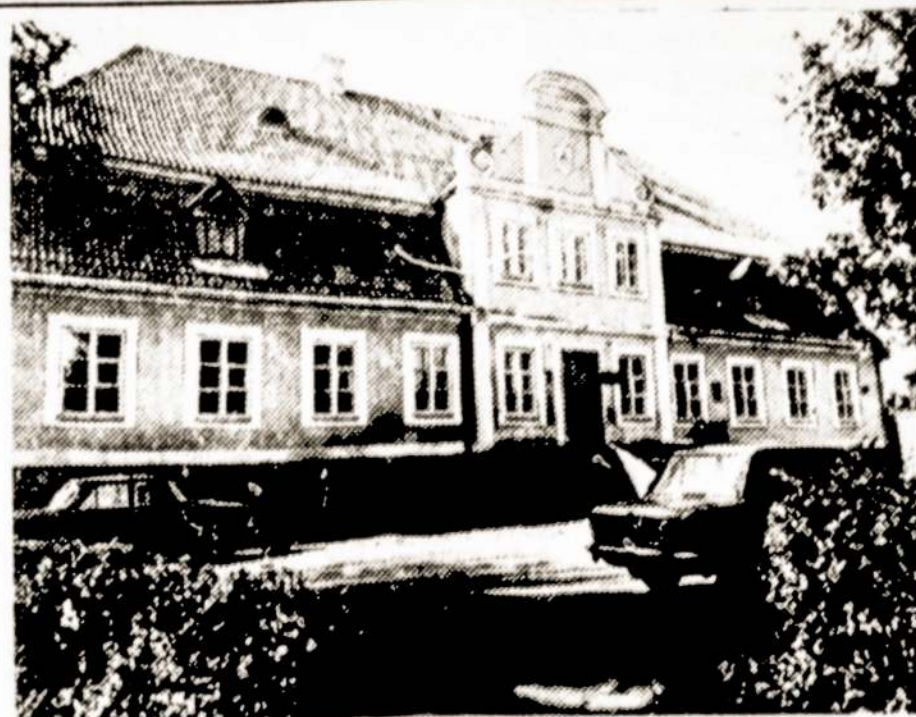
Nuotraukoje: Respublikinės reikšmės architektūros paminklas — restauruoti XIX amžiaus vidurio Kelmės dvaro rūmai. Dabar šiame pastate įsikūrusi Kelmės paukštinkystės tarybinio ūkio administracija.