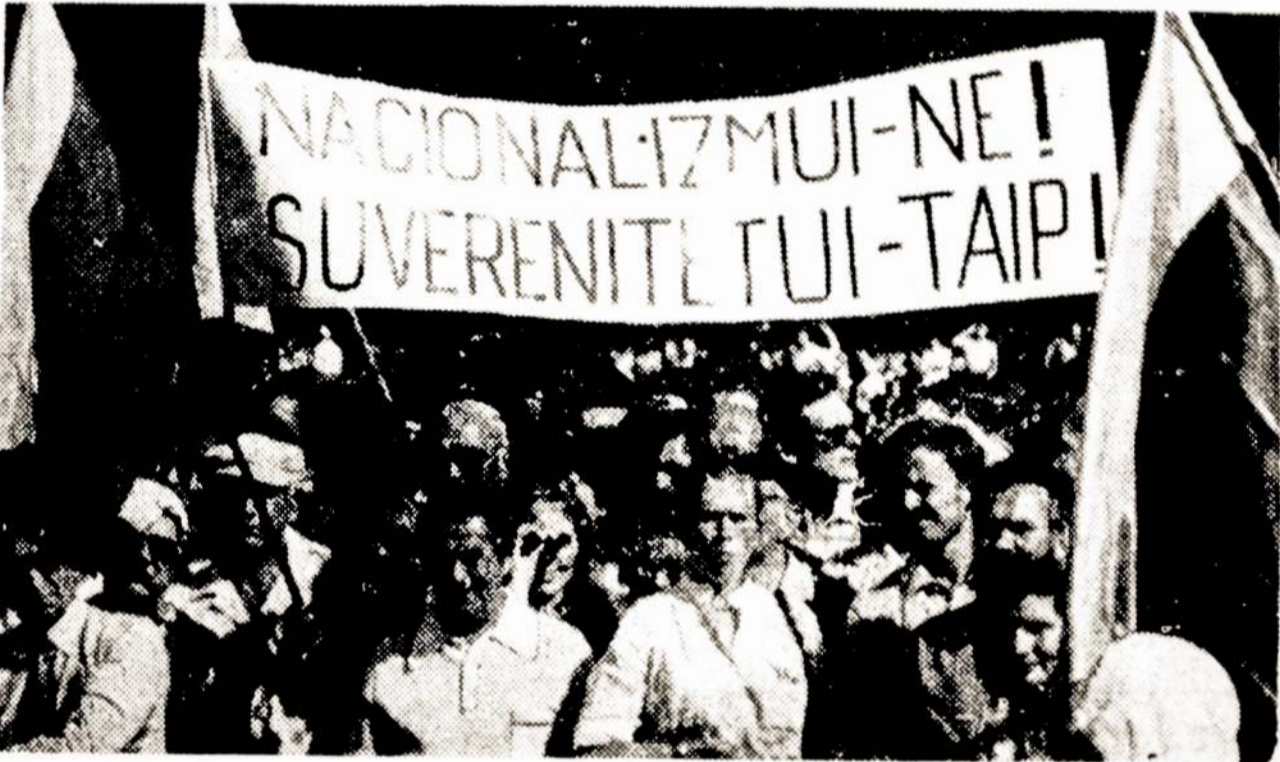
Vaidas iš Lietuvoje vykstančių mitingų.