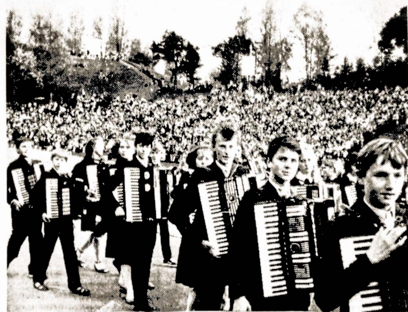
Triumfuoja Lietuvos TSR akordeonistai.

Jaunystė pasiklysta gyvenime, senatvė — autobiografijoje.