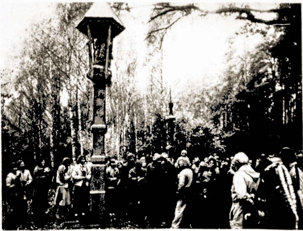
Nuotraukoje: Birštone atidarytas memorialas, skirtas stalinizmo aukoms.