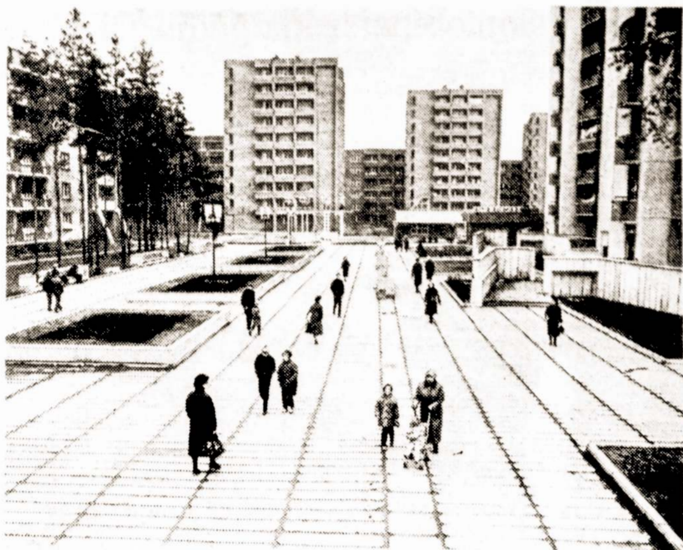
Sniečkaus gyvenvietė šiandien.