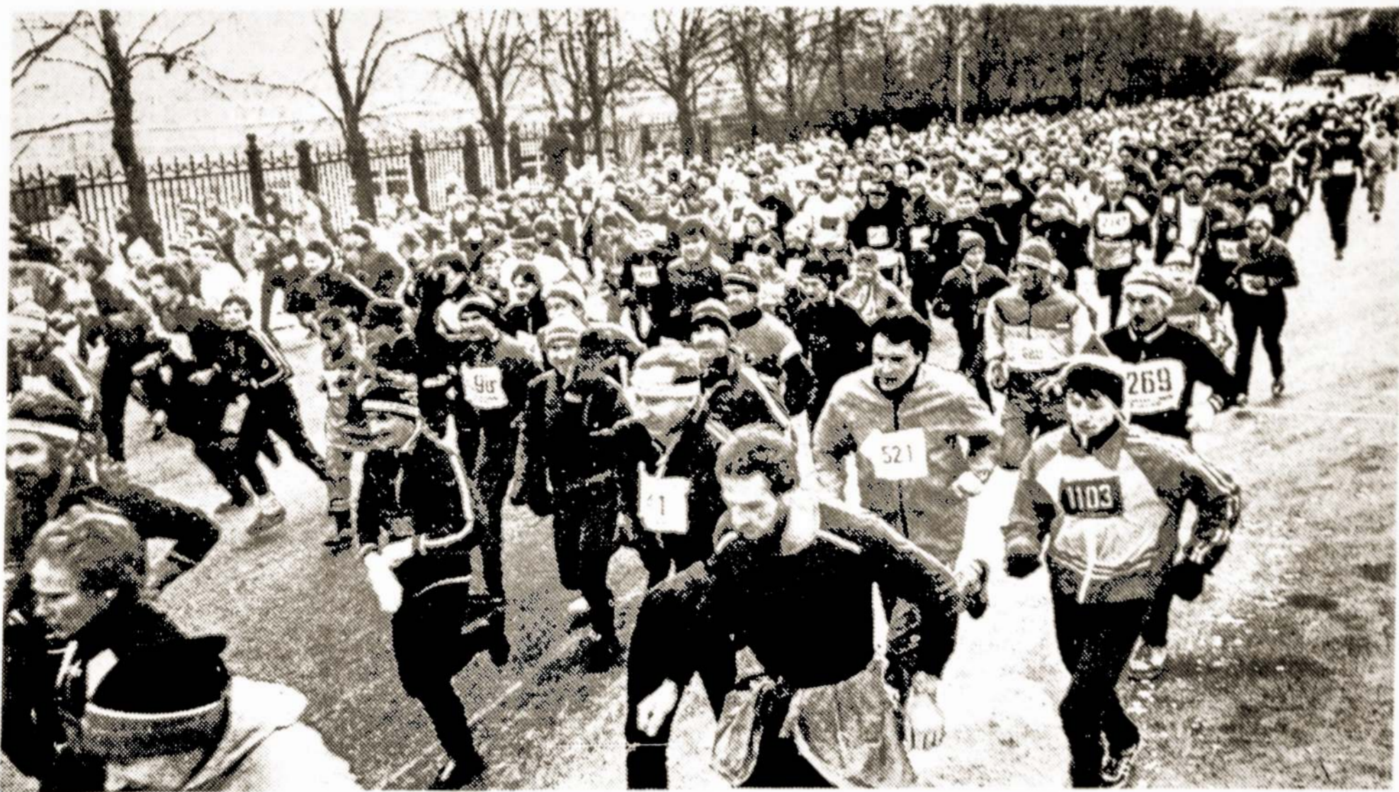
Vilniaus gatvėmis ir Neries pakrantėmis dvylika nelengvų kilometrų maratonas gruodžio 25 d.