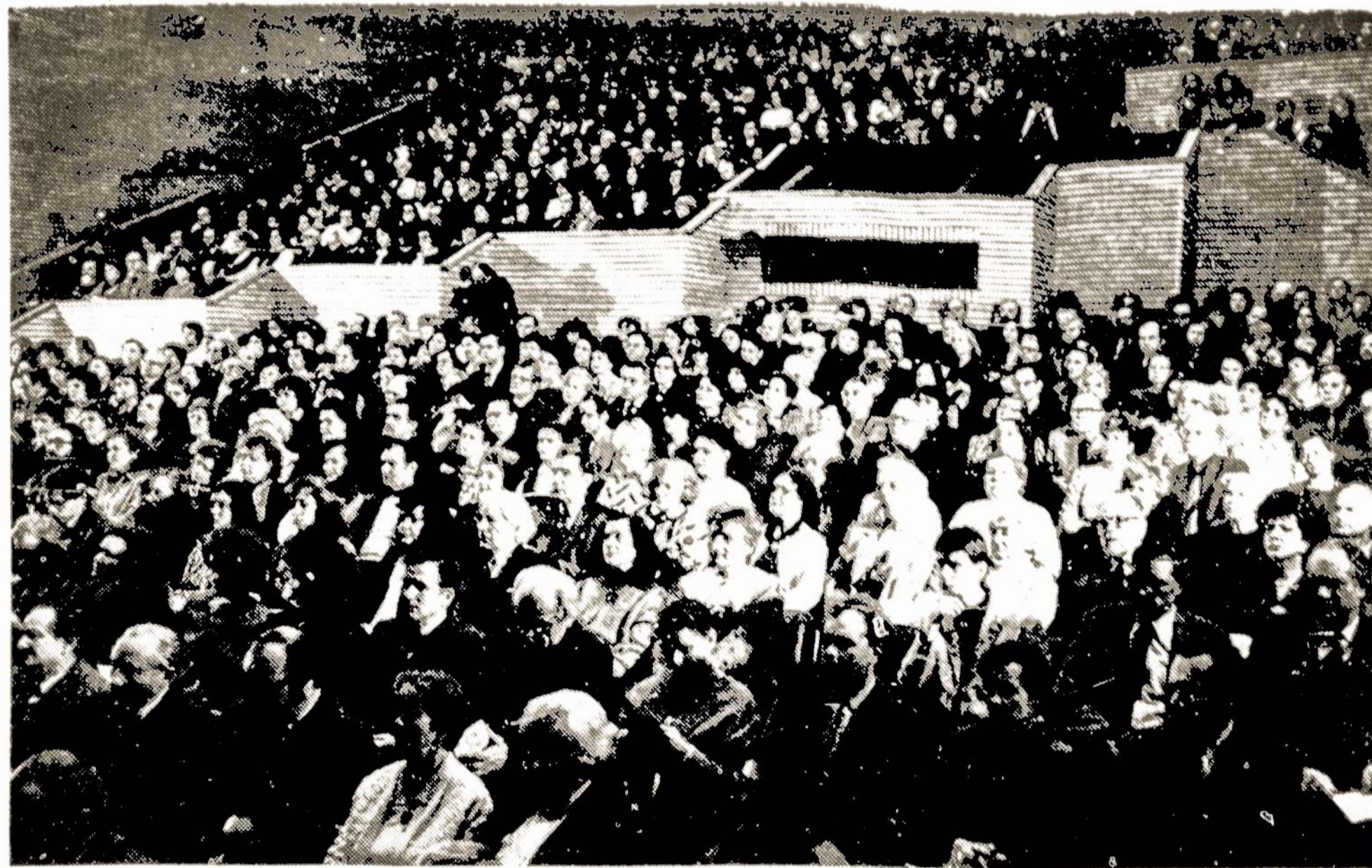
Gruodžio 26 d. Lietuvos TSR valstybiniame akademiniame dramos teatre įvyko Vinco Kudirkos 130-ųjų gimimo metinių ir jo įkurto "Varpo" 100-ųjų metinių sukakties minėjimas.

Iškilmingo minėjimo metu.