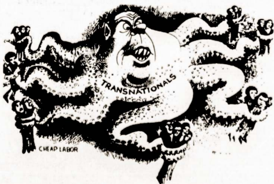
Taip transnationalinių korporacijų esmę mato karikatūristas iš laikraščio „People's Daily World“.