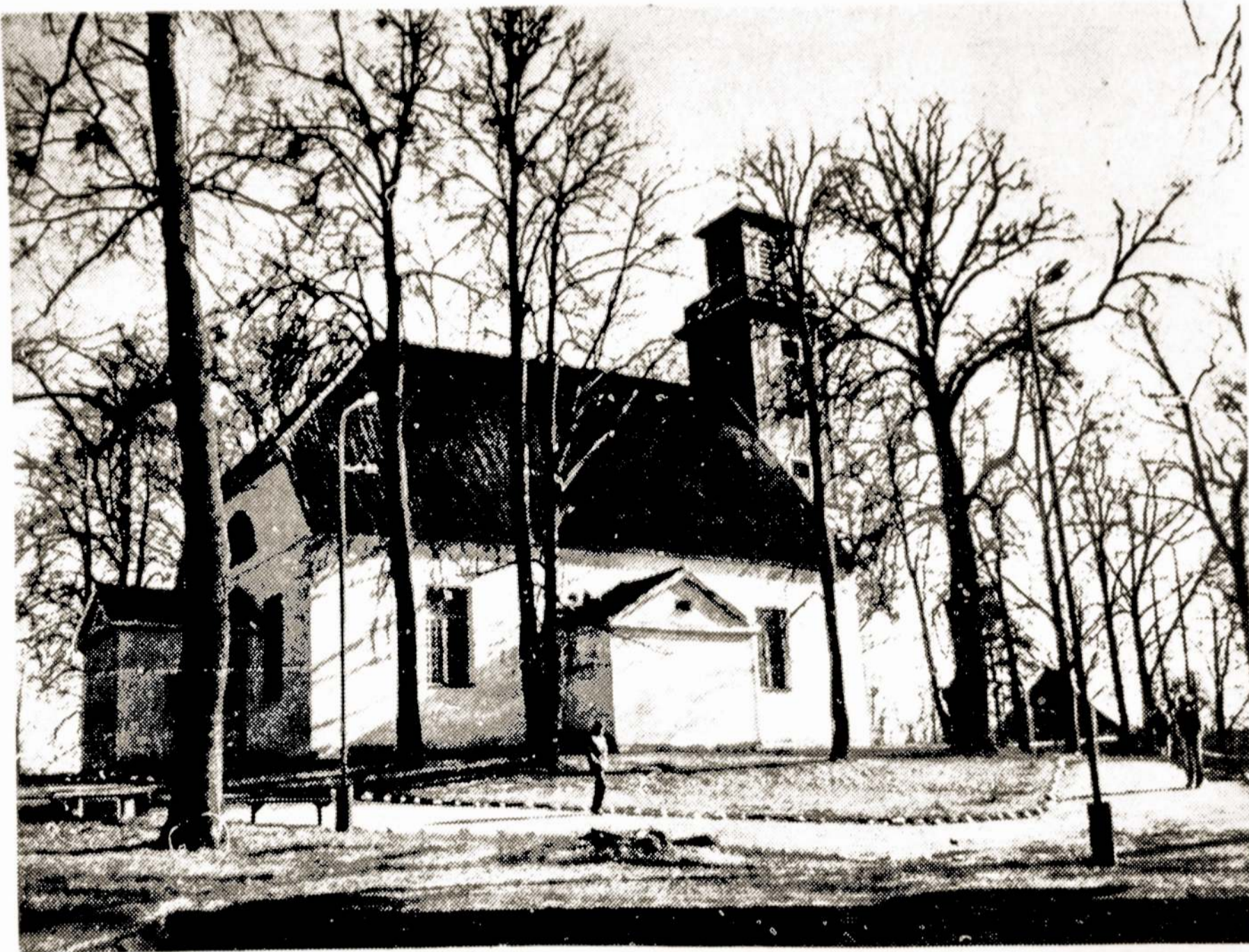
Buvusi Tolminkiemio bažnyčia, dabar — memorialinis K. Donelaičio muziejus.