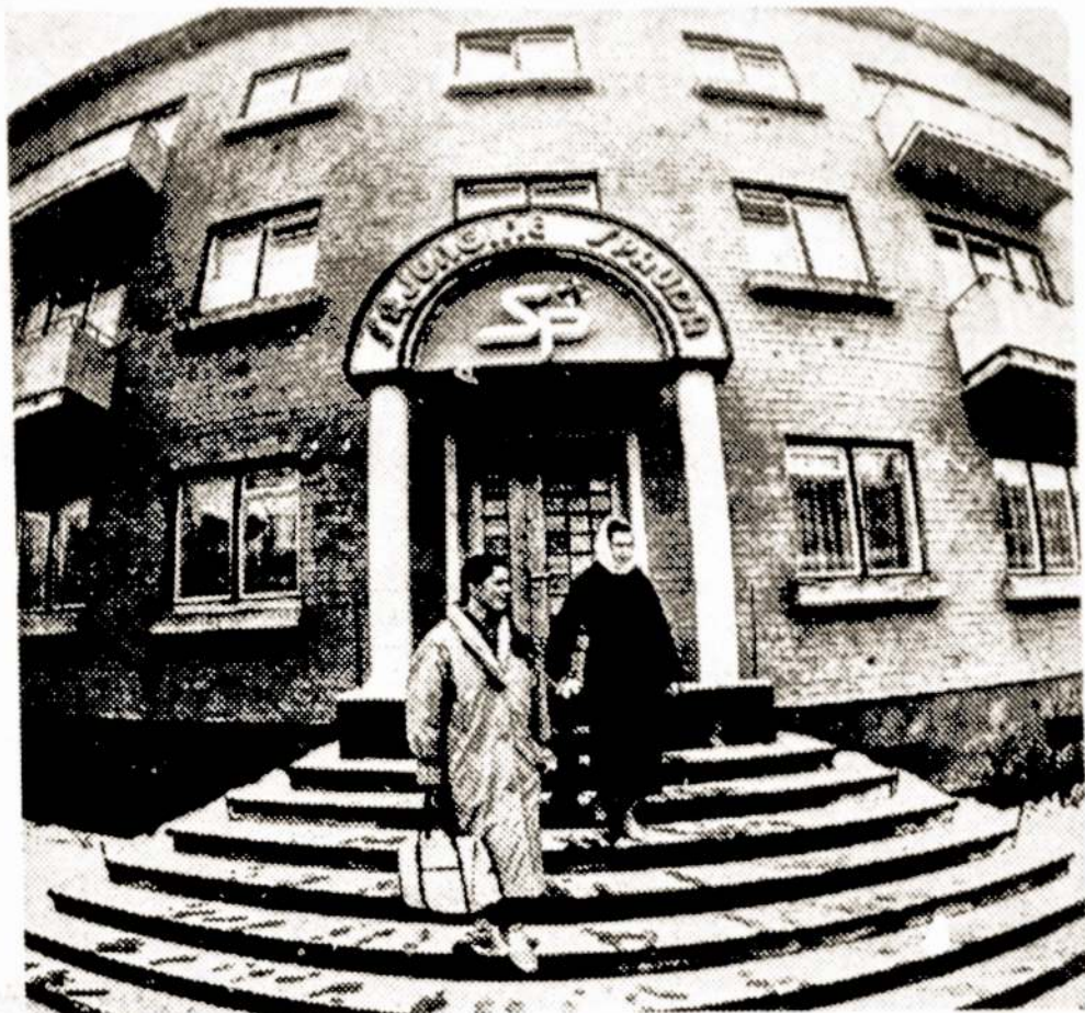
Mažeikiuose neseniai atidaryti "Sąjunginės spaudos" rūmai.