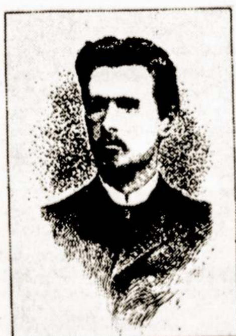
Dr. Vincas Kudirkas.