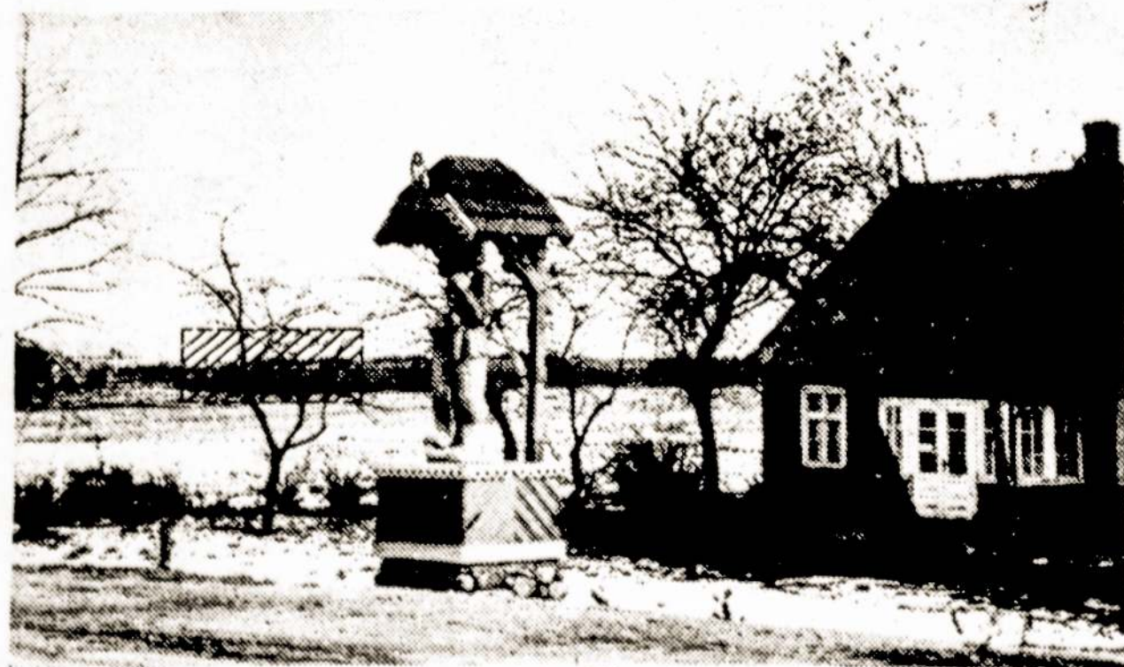
M. Valančiaus memorialinis muziejus Nasrėnuose.