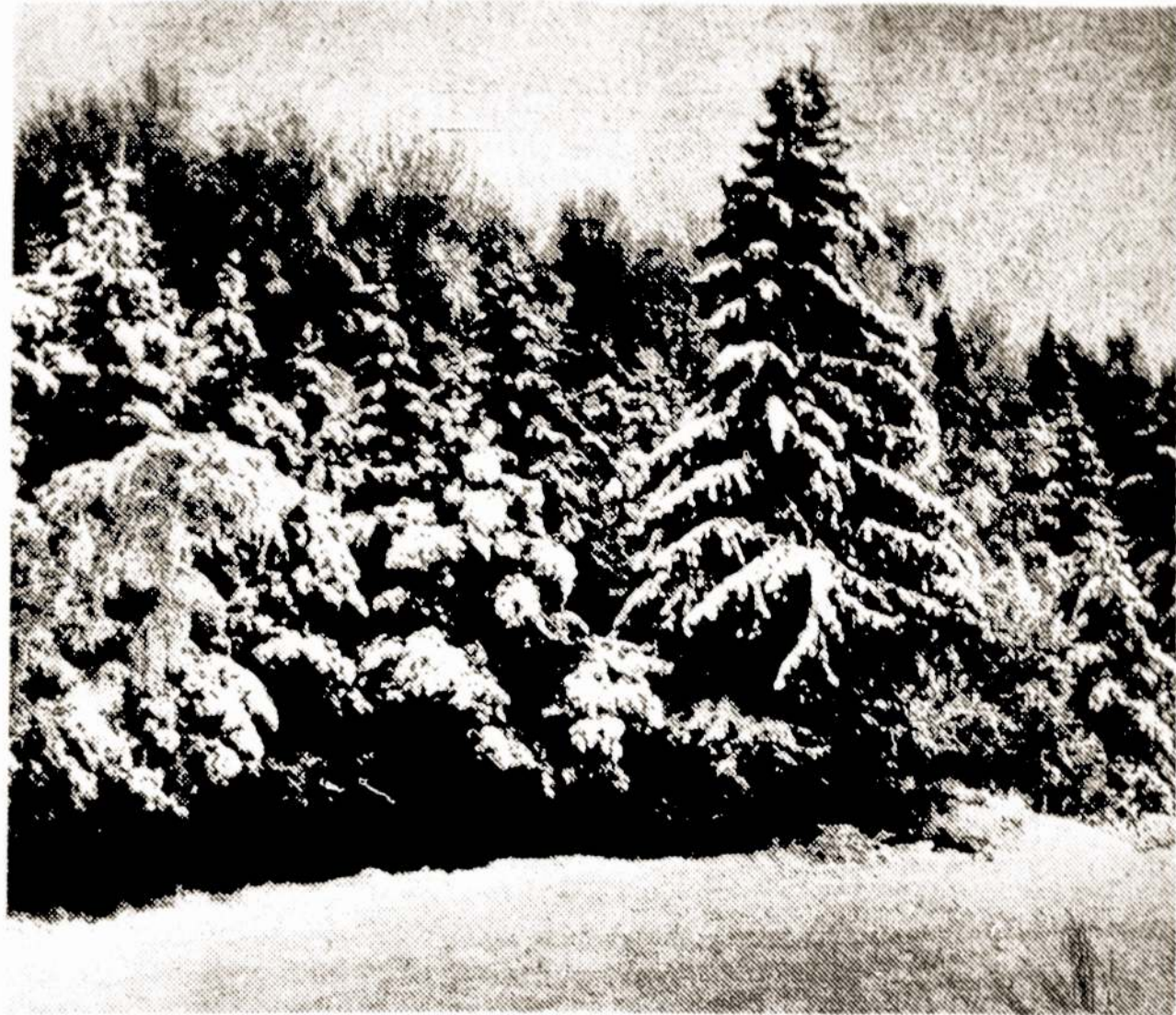
Lietuvoje šiemet žmonės išsiilgo tokių žiemų miškų.

"Lietuvos Laisvės Lyga" yra nacionalistų ekstremistų judėjimas, siekiantis Lietuvoje atstatyti buržuazinį režimą. Maždaug toks judėjimas, kaip pas mus išeivijoje