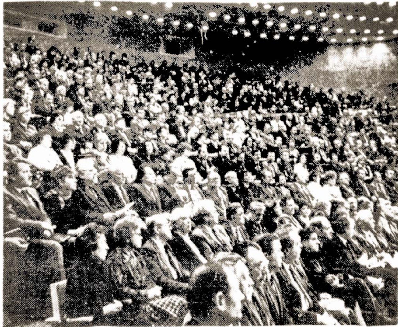
Sausio 17 dieną Vilniuje įvyko žurnalistų suvažiavimas, kuriame dalyvavo 470 žmonių. Nuotraukoje - suvažiavimo vaizdas.

Argi ištis taip? Faktai rodo, kad Lietuvos žmonių požiūris į religiją pusėtinaisi pasikeitęs. Išgalint viešumai, tarsi grypai po lietaus,