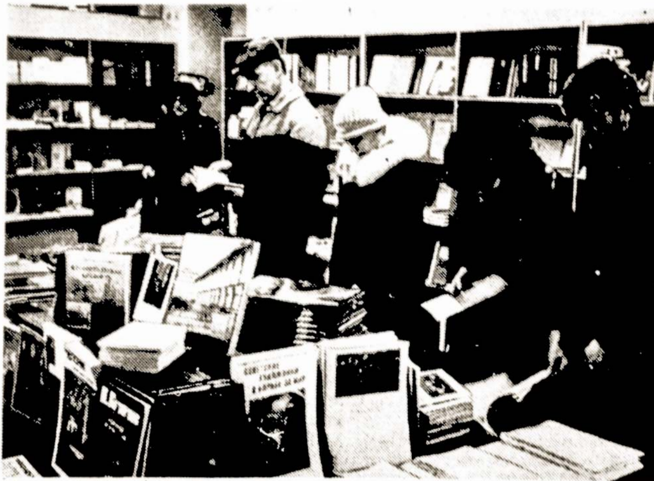
Knygynas, ryšių skyrius avalynės atėlje, kirpykla, taupomoji kasa įsikūrė Kaune Kalniečių rajone, šalia prekybos centro „Kalniečiai“.

gimė lietuvių kompozitorius ir pedagogas, vargonininkas, chorų vadovas Juozas Naujalis. Jis, pelnęs lietuvių muzikos patriarcho vardą, įvairiose Lietuvos muzikinio gyvenimo srityse buvo pirmuoju, taip pat daugelio reikšmingų kultūros darbų iniciatoriumi. Dar lietuviško žodžio draudimo metais jis sukūrė vėliau išaugusią ir išgarsėjusią „Dainos“ draugiją. 1905 metais įsteigė pirmąją lietuvišką knygyną Kaune, 1913 metais įkū-