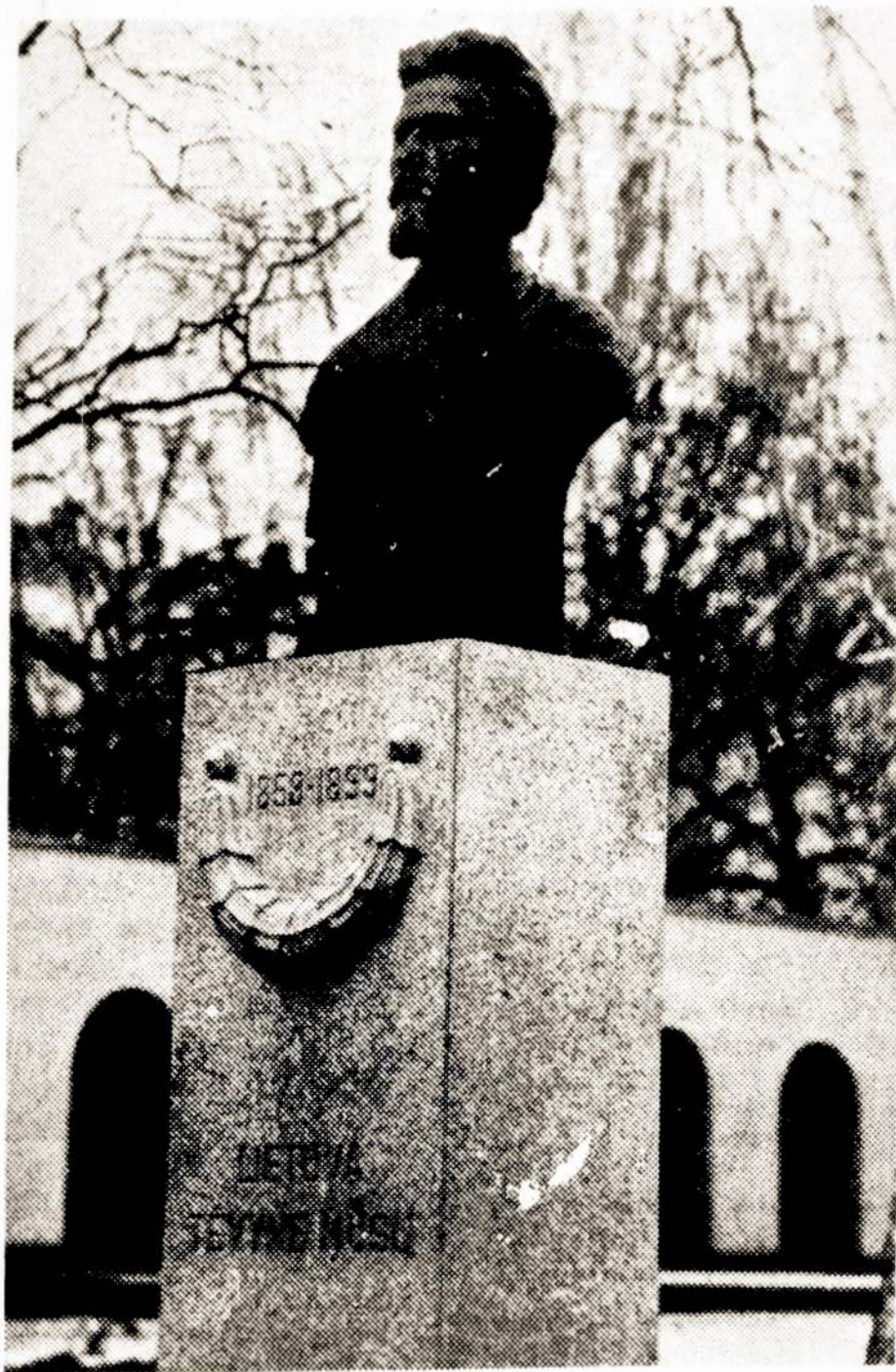
Keičiasi Kauno istorijos muziejaus sodelis — visiems lietuviams brangi vieta. Jame atstatyti V. Kudirkos, J. Basanavičiaus, S. Daukanto ir Maironio bustai. Paruoštas sodelio teritorijos sutvarkymo projektas. Nuotraukoje: Vinco Kudirko biustas.