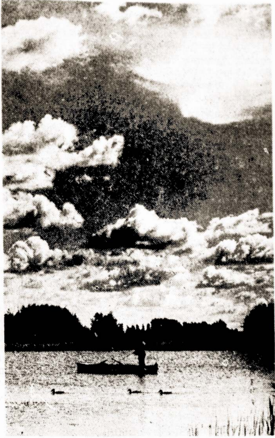
Vasaros malonumai Lietuvoje.