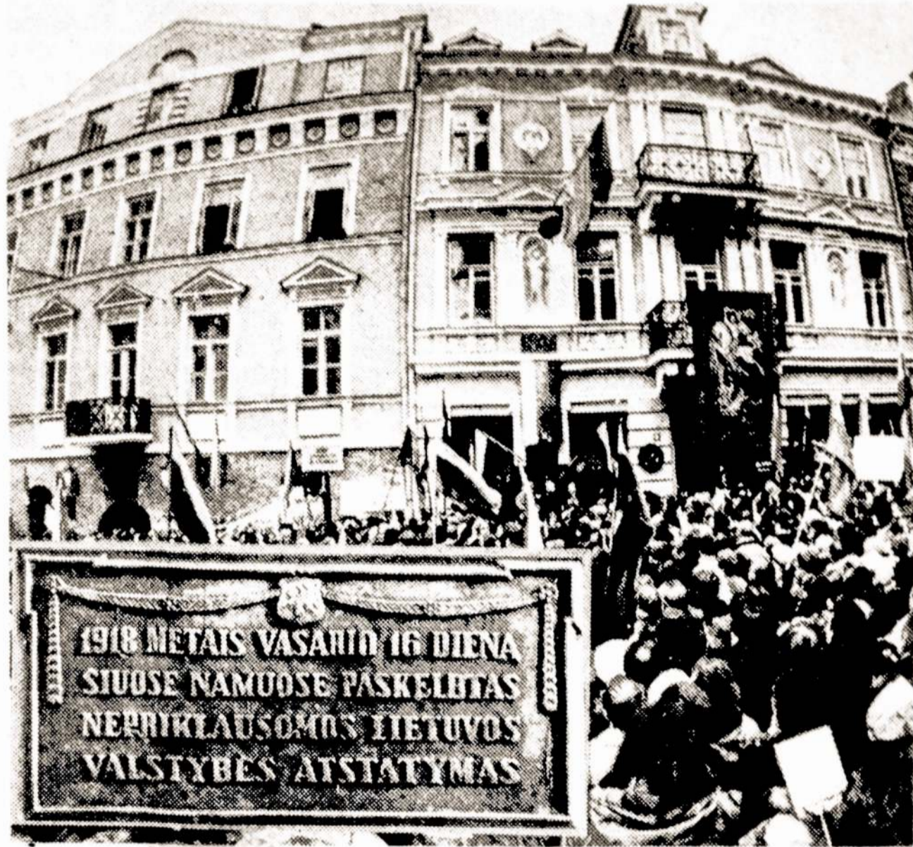
Vilniuje prie namo Pilies gatvėje Nr. 26, kuriame 1918 metais vasario 16 dieną buvo pasirašytas Lietuvos Nepriklausomybės paskelbimo aktas, šiomet per Vasario 16 iškilmes atidengta lenta.