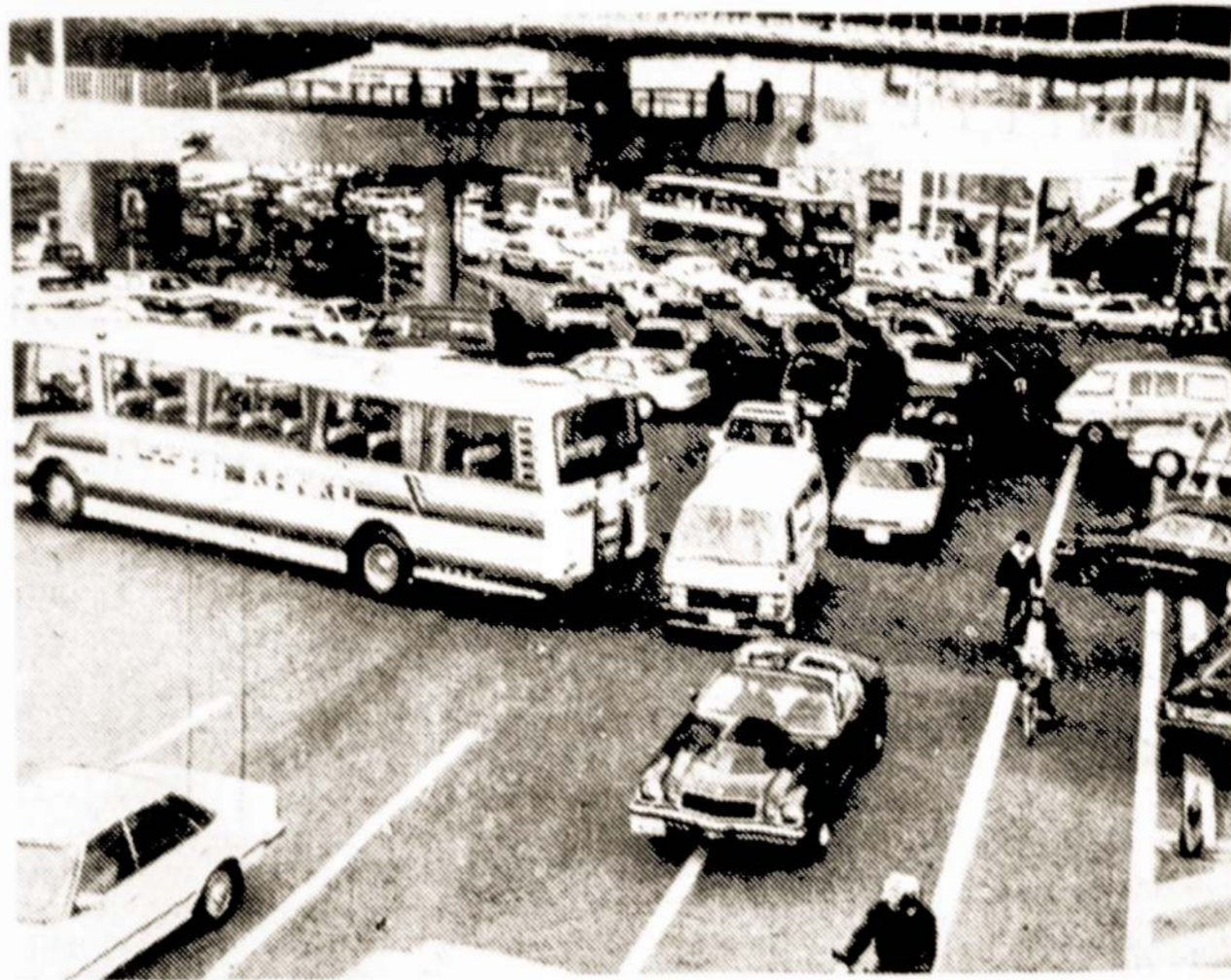
Tokijo gatvė piko valandomis.