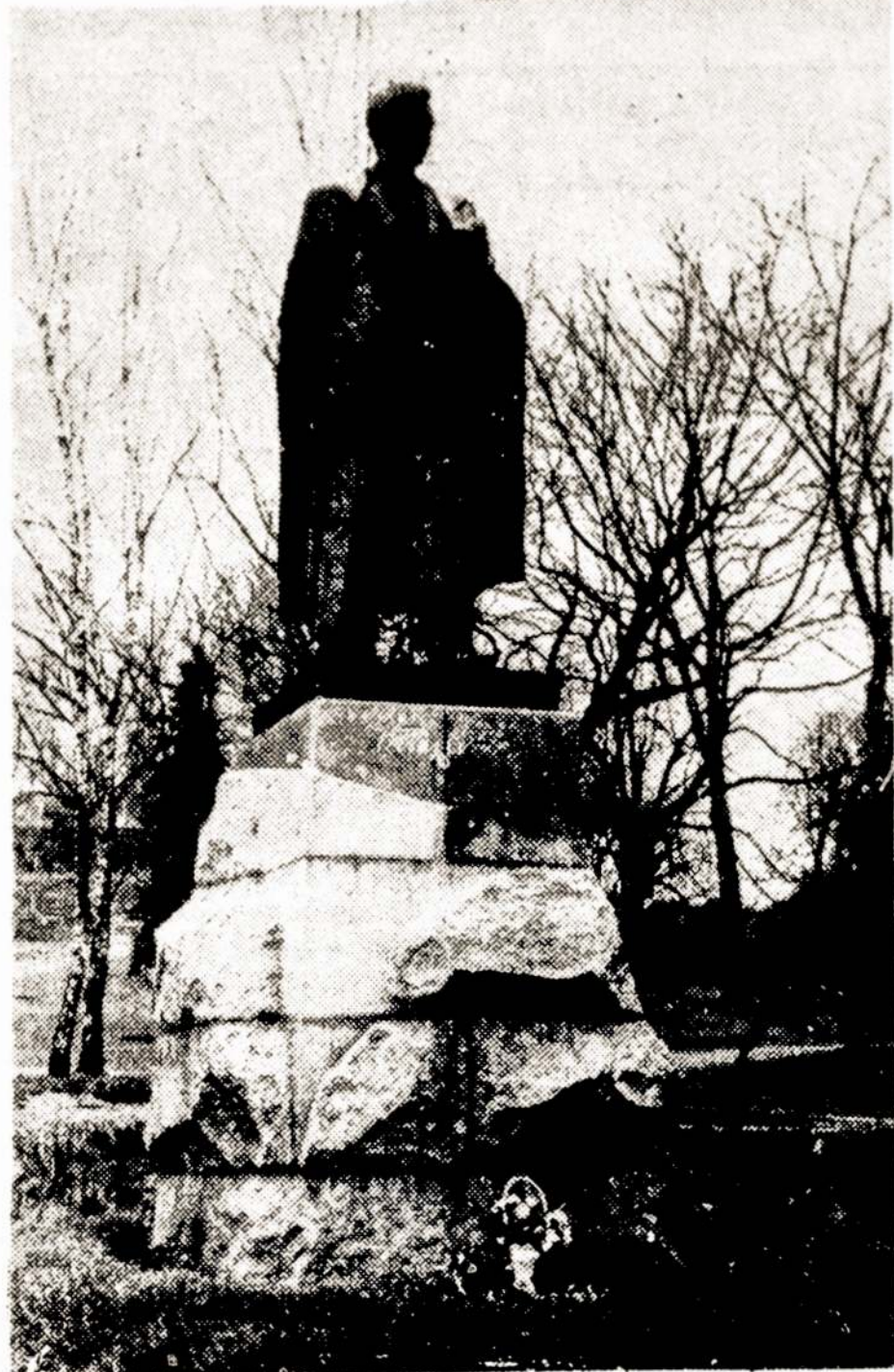
Petro Cvirkos paminklas Vilniuje.