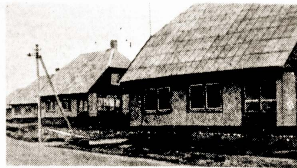
Savita ir graži Ramygalos gyvenvietė. Praliesiems prie gražio, norisi jo dar daugiau. Kolūkio jaunimas apzeldins užtvanką, padidintą juokais Samsono jūra (mat ji netoliese kolūkiečių Samsonų namų), įsirengs dar viengą jaukų kempelį.

— Deja, ženklai plačiai po kraštą nepaplito ne tik dėl mažo tiražo, bet ir todėl, kad visą laidą per penkiolika dienų išpirkė vokiečių kariai ir civiliai pareigūnai, atstovaujantys Vokietijos filatelijos prekybininkams. 1918 m. gruodžio pabaigoje šiais ženklais tebuvo aprūpinti Vilniaus ir Gardino paštai. Į pastarąjį, kaip teigia JAV