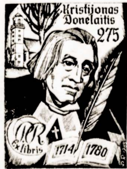
Petro RAUDUVES ekslibrisas

● Gatvė žmogų išmuša iš pusiausvyros. Šiuo metu labai nepageidautinas ne vienas neatsakingas pareiškimas. Gerbkime kaimyną, gerbkime kito jausmus ir nuomonę. Sugyventi reikia mokėti. Nereikia nei vyresniojo, nei jaunesniojo brolio... Visi mes esame motinų vaikai. Pranašumą turėtų nulemti nebent protas, garbė ir sąžinė.