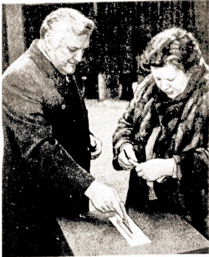
Balsuoja Lietuvos Komunistų partijos Centro Komiteto pirmasis sekretorius Algirdas Brazauskas su žmona Julija.