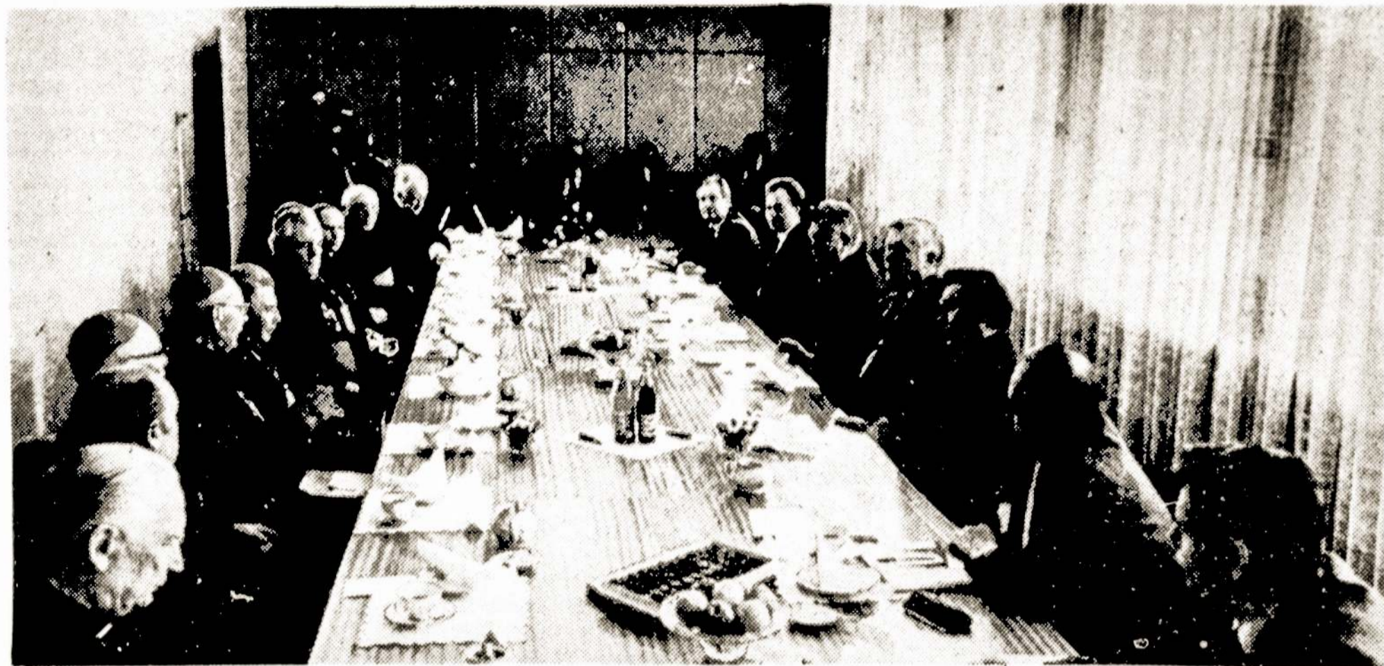
Kovo 28 dieną Lietuvos TSR Ministrų Tarybos rūmuose Algirdas Brazauskas, Vytautas Astrauskas, Vytautas Sakalauskas, Valerijonas Baltrūnas susitiko su Lietuvos katalikų bažnyčios, Lietuvos evangelikų liuteronų bažnyčios, Lietuvos stačiatikių bažnyčios aukštaisiais dvasininkais.