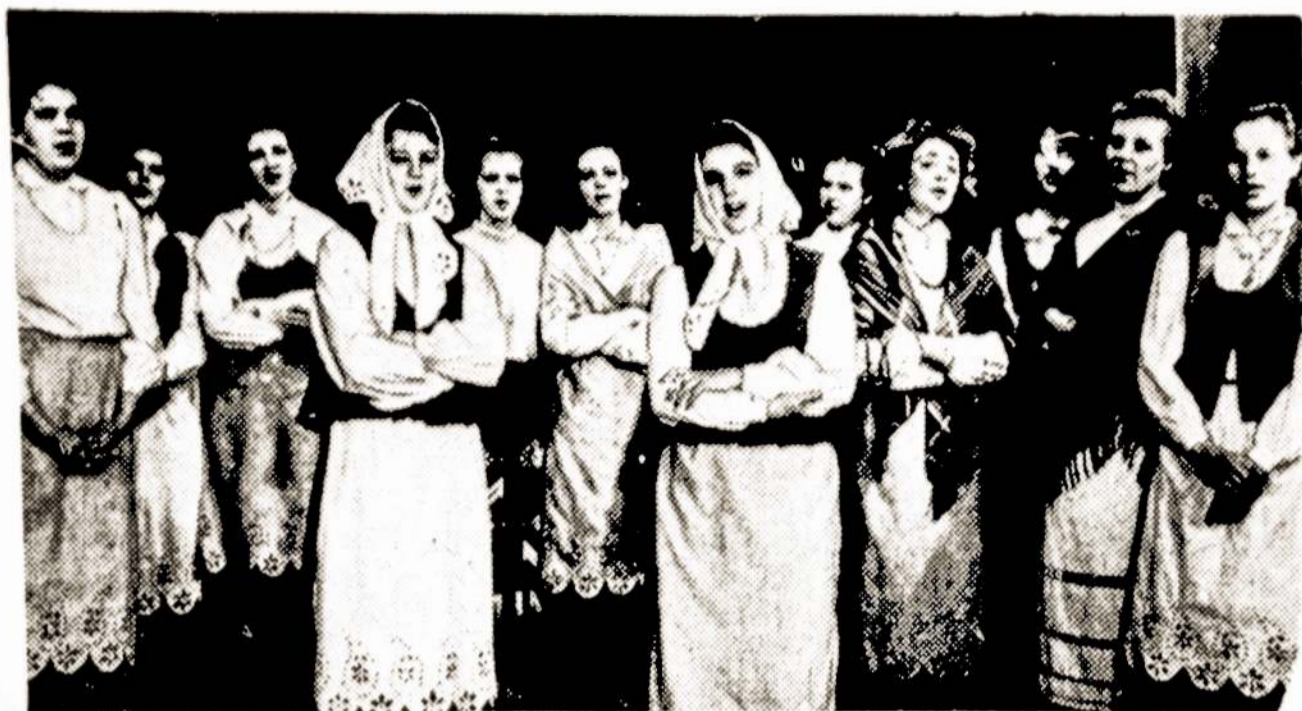
Telsių kultūros mokyklos folklorinis ansamblis.