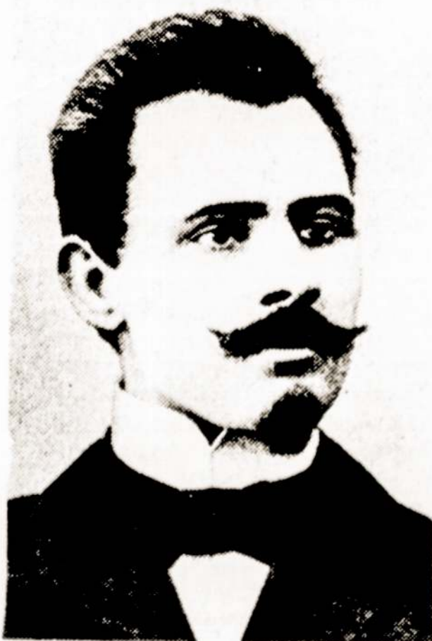
Rašytojas Jonas Bilūnas jaunystėje.