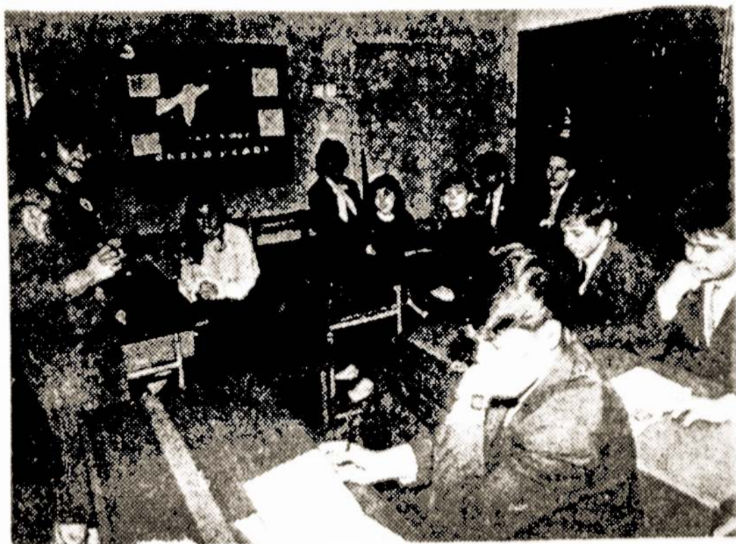
Neseniai Lietuvoje viešėjo grupė JAV moksleivių iš New Jersey, Ohio Illinois valstijų.

JAV moksleiviai pamokoje Vilniaus S. Neries vidurinėje mokykloje.