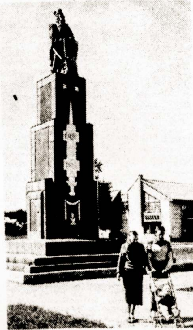
Jau daug metų Varėnos rajone, Perlojoje stovi Vytauto Didžiojo paminklas. Viktoras Armašius Vilnis, 1989 m. birželio 22 d.

Iki šiol Vilniaus universiteto mokslinė biblioteka daugiau kaip 20 metų buvo vienintelė Pabaltijoje Suvienytųjų Nacijų Organizacijos D. Hameršeldo bibliotekos depozitorė ir gaudavo jos savarakiškų organizacijų leidinius. Jolanta Cepukalytė