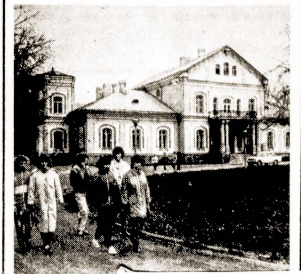
Buvusiuose Molėtų rajono Pamarneckių rūmuose po remonto atidaryti Naujasodžio kultūros rūmai. Čia įsikūrė vaikų baleto studija, liaudies šokių kolektyvas, kaimo kapela, etnografinis ansamblis.