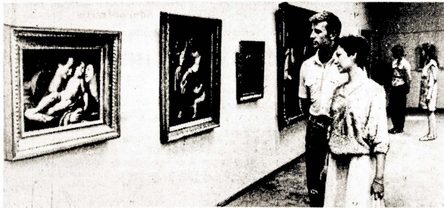
Naujoji Mykolo Žilinsko dailės galerija.