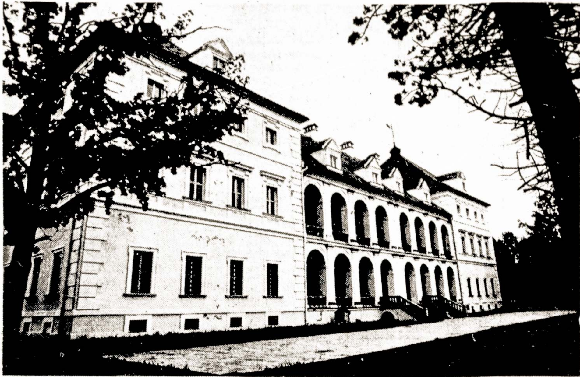
Biržų pilies rūmai šilandien.

Užregistruotų nusikalstamų skaičius Respublikoje, palyginti su praėjusiais metais, padidėjo 66,3 proc., padaryta 36 proc. daugiau sunkių nusikalstamų. Vien tik per šiuos metus keturis mėnesius Lietuvoje užregistruota daugiau kaip 6 tūkstančiai kriminalinių nusikalstamų. Tai beveik dvigubai daugiau nei pernai per tą patį laikotarpį. Tarp šių nusikalstamų — 71 plėši-