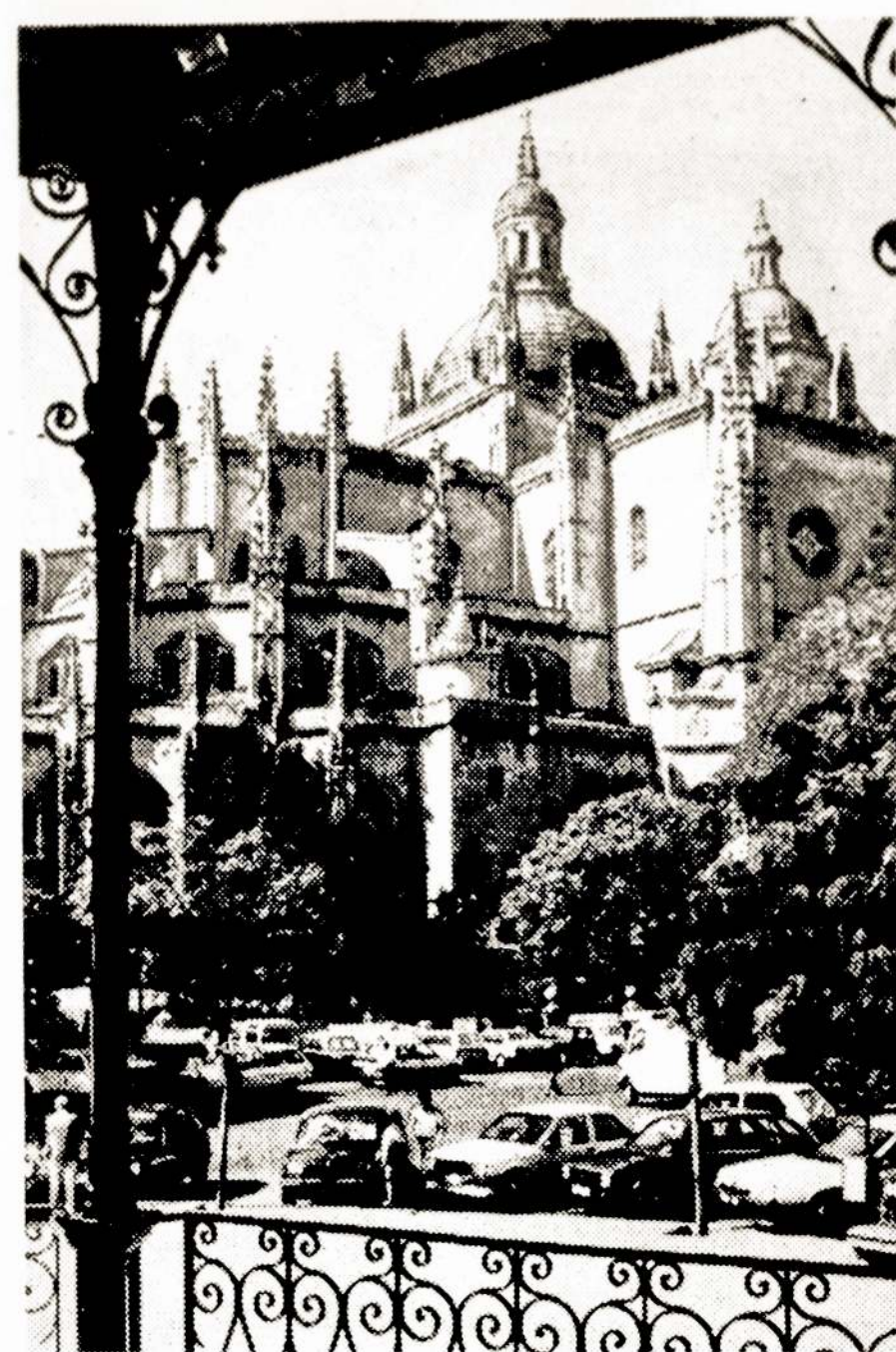
Segovija — vienas seniausių Ispanijos miestų. Čia atvykę turistai visada aplanko dar XI amžiuje pastatytą Alkasaro pilį. Nuotraukoje: miesto fragmentas.