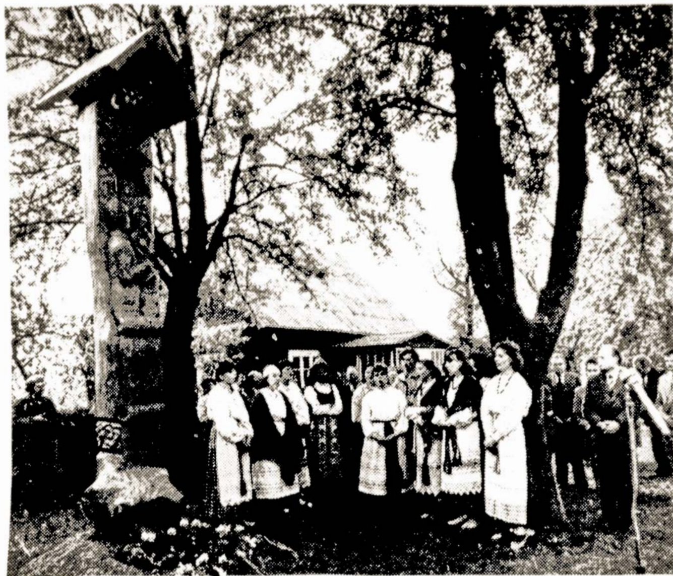
Grupė talkininkų prie K. Donelaičio atstatytos klebonijos.