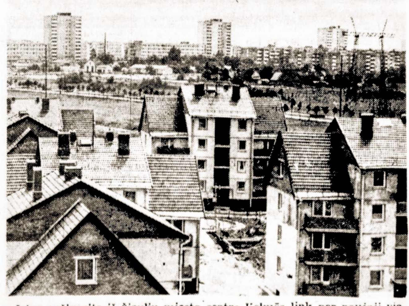
Jeigu važiuosite iš Šiaulių miesto centro Kelmės link per naująją viaduktą, kairėje kelio pusėje pamatysite gražios architektūros gyvenamuosius namus. Tai trijų ir keturių aukštų monolitiniai pastatai, kuriuose įrengta po 6-8 butus.

— Baik kibti. Buk tu kuo nori ir leisk man būti kuo noriu, — stengėsi greičiau atsikratyti savo pašnekovu lietuvis. Tai buvo senokai, ir niekuomet nemaniau, kad toks „menkniekėlis“ iškiš atmintyje, iškilo. Žmogus-lietuvis išlipo (Nukelta į 8 pusę.)