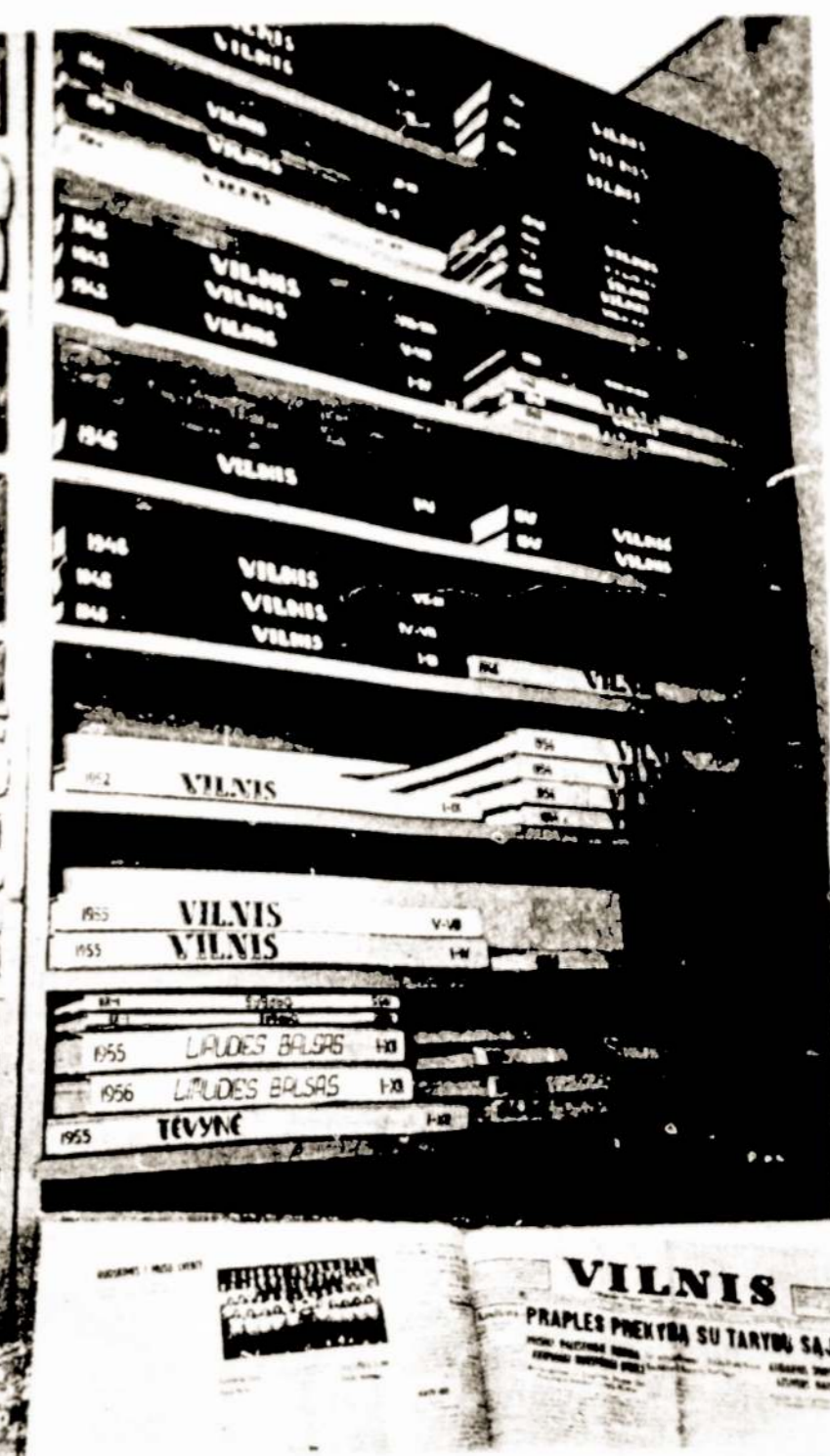
Globoja Lietuva ir „emigravusius“ iš JAV laikraščio „Vilnis“ komplektus, sukrautus Komunistų partijos Istorijos instituto bibliotekoje Vilniuje.

štų debatų, nuomonės pasidalina. Tad rudens sesijoje buvo pareikš- ta, kad iškyla daug procedūrinių nesklandumų, rengiant dokumen- taciją, informacinius biuletenius, ypač skaičiuojant balsus. Supran- tama, kad tam Aukščiausiosios Tarybos aparatas negalėjo per trumpą laiką deramai pasiręgti. Dabar padėtis taisoma. Ir pirmia- usia viskas daroma tam, kad depu- tatų laikas būtų taupomas, svar- bių valstybinių reikalų spren- dimui, o ne švaistomas įvairioms procedūrinėms operacijoms.