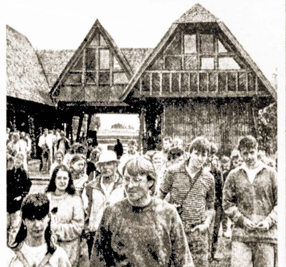
Kursų klausytojai buities muziejuje Rumsiškese.