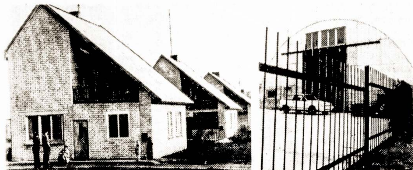
Čia gyvena kolūkio mechanizatoriai; atsarginių dalių sandėlis „Tiesos“ kolūkyje.