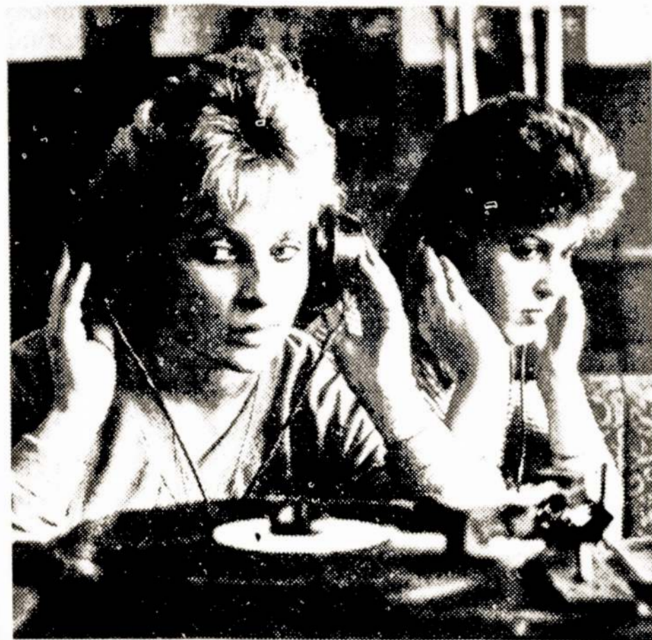
Netrukdam kitiems, galima pasiklausyti muzikos.

Netoli Anykščių įsikūrusius „Šilelio“ poilsio namus papildė naujas 117 vietų korpusas.