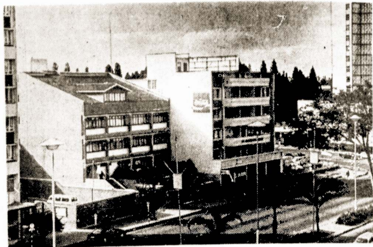
Bulavajos mieste sukonzentruota atgimstančios Zimbabvės pramonė. Čia matome vieną šio miesto gatvių.

vai galėtų išsirkinti sau reikalingus projektus. Kol kas mokslininkai ir išradėjai pernelyg užimti žmonės, kad patys galėtų ieškoti sau klientų. Tuo tikslu prie mokslinės techninės kūrybos draugijos įsteigtas mokslinių techninių paslaugų ir jų propagandos centras. Jis jau priėmė iš įmonių pirmuosius užsakymus. Jei centro idėjų banke nebus reikalingų projektų ir idėjų, spręsti gamybininkams rūpimai problemai sudaromi laikini kūrybiniai kolektyvai. Norą dalyvauti juose pareiškė daug garsių respublikos mokslininkų ir išradėjų. Centras taipogi imasi užmegzti tarptautinius kontaktus su atitinkamomis organizacijomis užsienyje. Manoma, kad pelnas, gaunamas nuo intensyviai panaudojamu mokslinių techninių idėjų