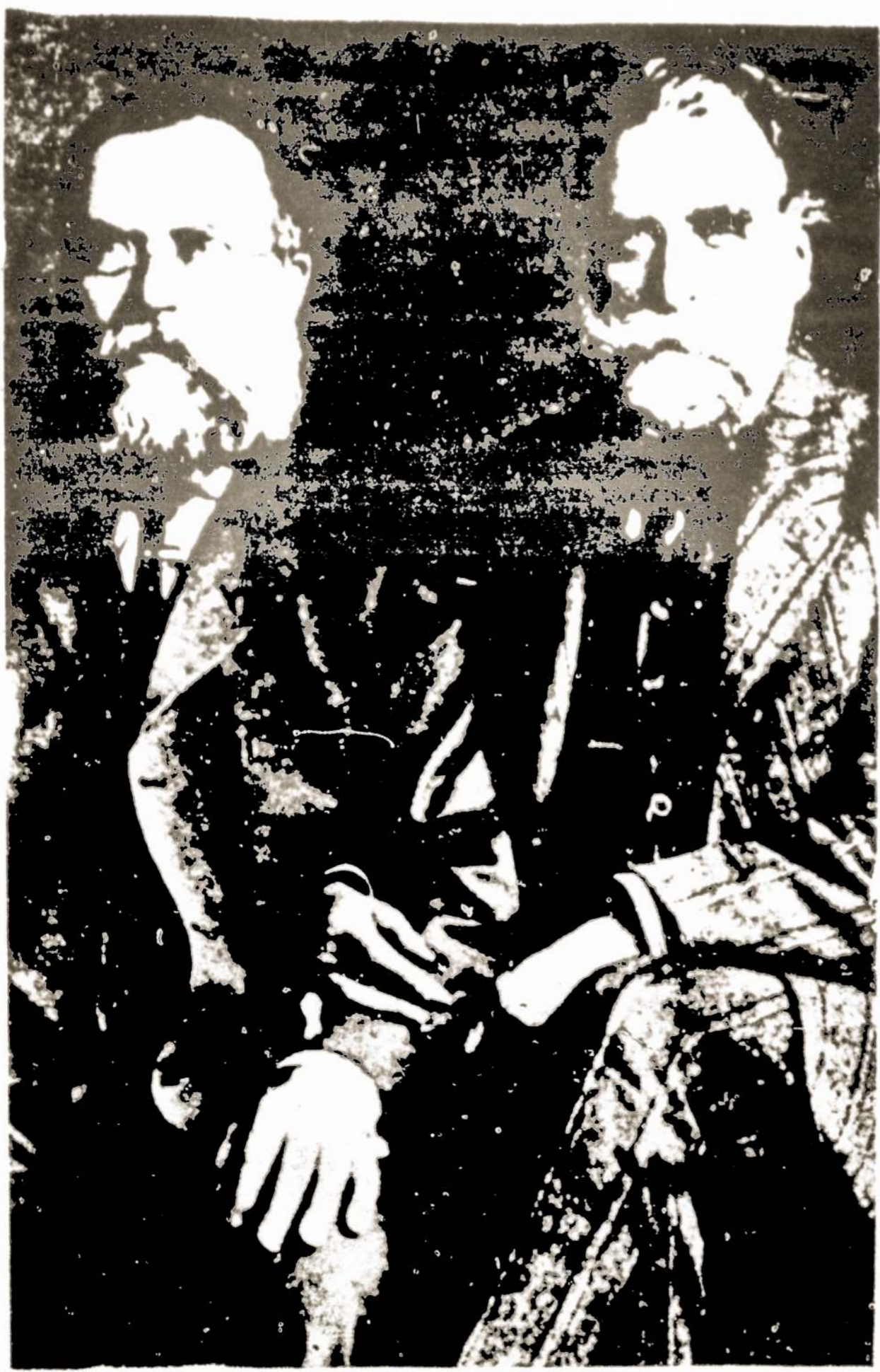
Lietuvių tautinio atgimimo patriarchai Jonas Šliūpas ir Jonas Basanavičius Skrantone (JAV) 1913 metais.