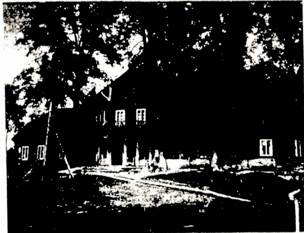
Silo Pavežupio kaimas, Kelmės rajone, buvę Putviškio dvaro rūmai. Čia buvo slepiama ir skirstoma nelegali spauda, vyko P. Višinskio organizuoti slapti literatūros vakarai. Sudėgė 1983 metais.

Pirmųjų lankytojų atsiliepimai parodė, kad savo tikslą jaunimu pasiekti pavyko. Klube sudarytos visos sąlygos įvairiapusiškam ir turiningam poilsiui. Čia pasirodė ir repetuoja ūkio estradinis ansamblis, liaudies dainų ir šokių kolektyvai, meninė agitbrigada. Klube vyksta skaitlingos jaunimo disko tekos, vakaronės, kurių metu pagerbiami darbo pirmūnai — jau