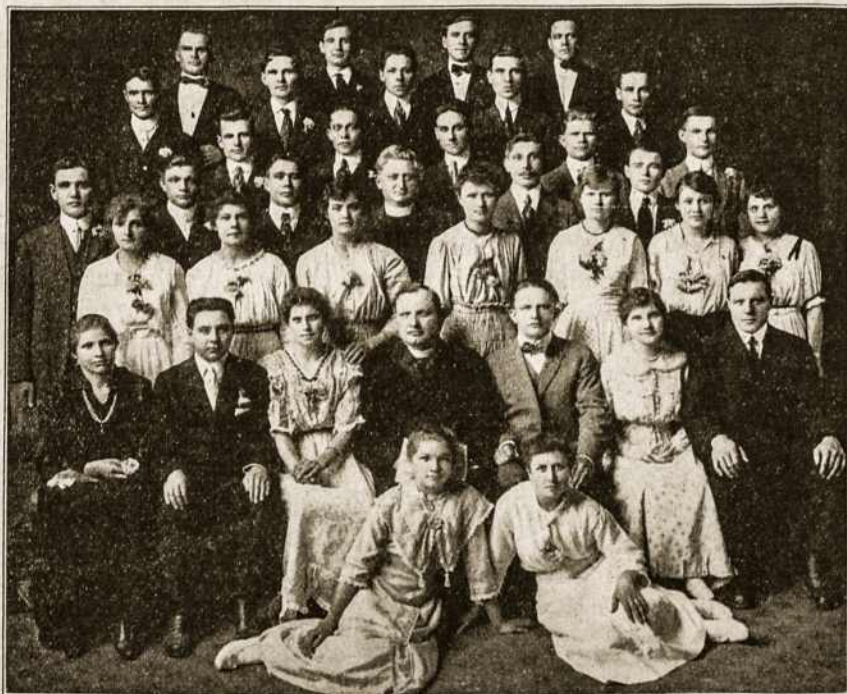
Lietuvos Vyčių 51 kuopa (Birželio 11 d., 1916 m.) Sheboygan, Wis.