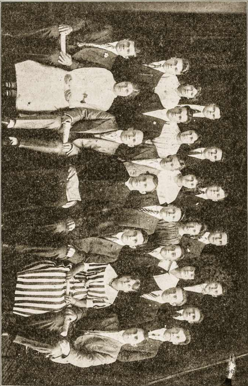
Lietuvos Vyčių 35 kuopa, Pullman, Ill.