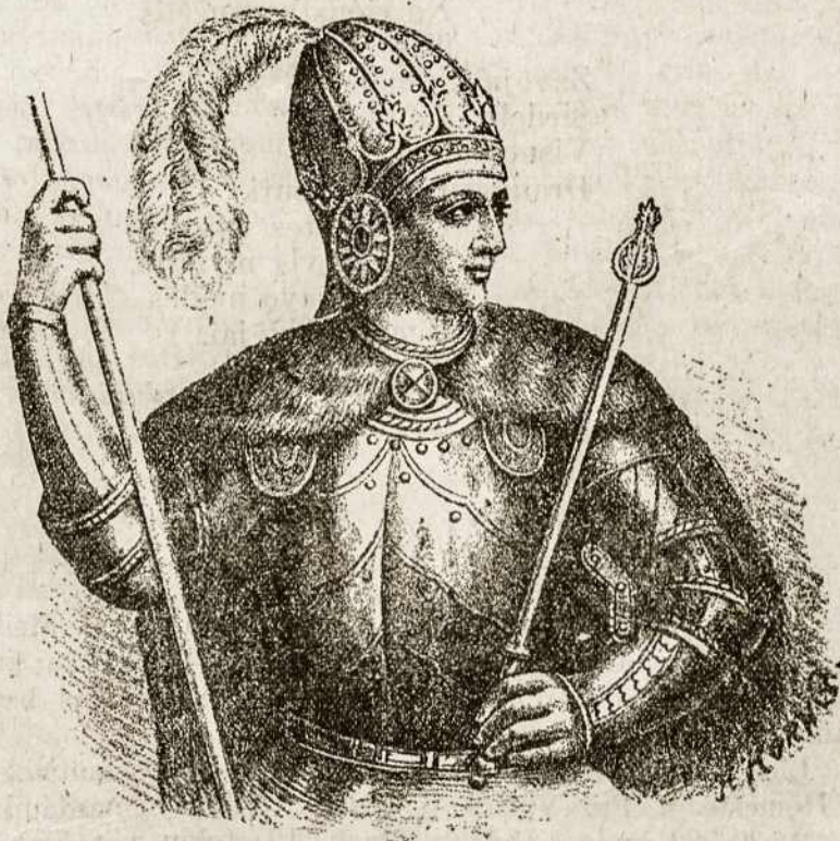
D. L. K. Vytautas. Liet. Vyčių drąsios idealas.