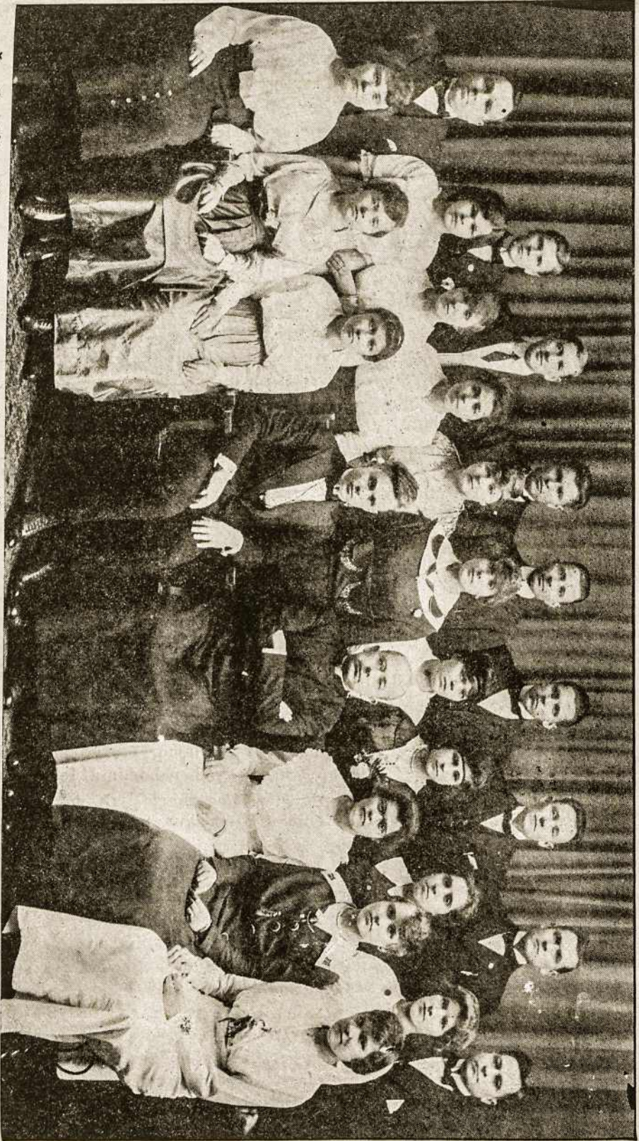
Su. Cecilia's Chorus, Hartford, Conn. (Six choruses performed Sav. Vyti, aukodamas $25.00).