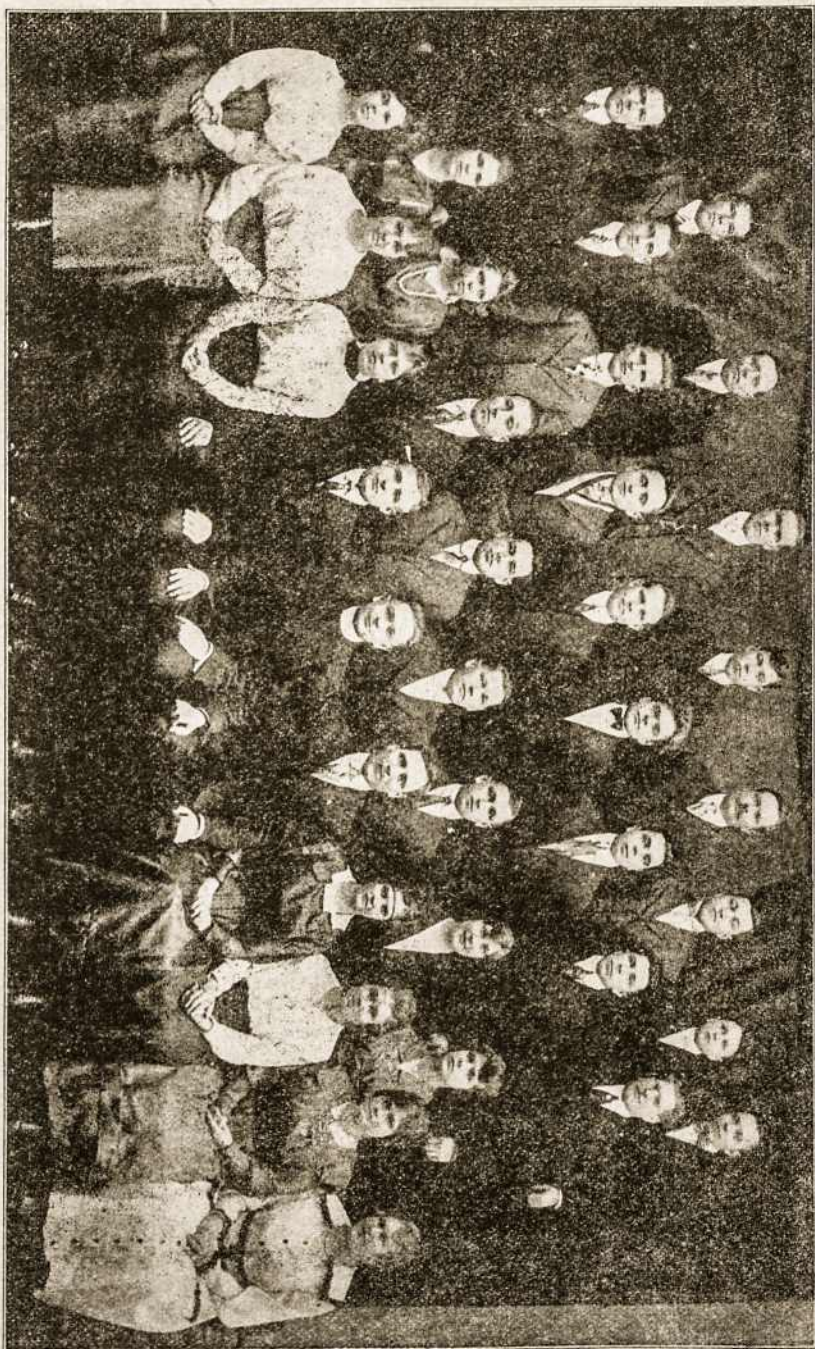
Liet. Vycių 8-toji kuopa Roseland, Ill. Viena veiklausių kuopų Vycių organizacijoje.