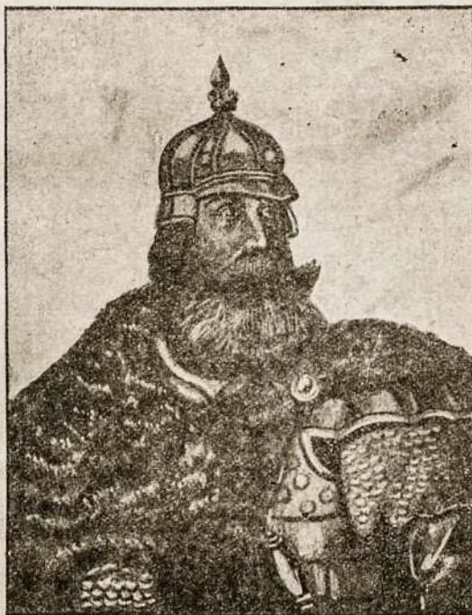
D. L. K. KEISTUTIS (1381 -- 1382).