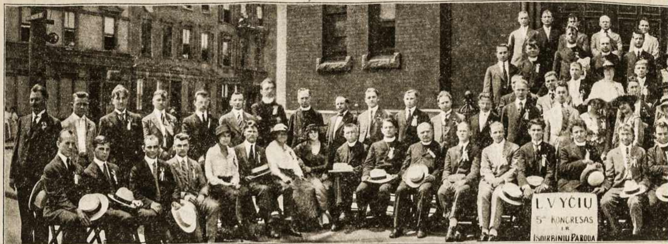
(Delegatai Lietuvos Vyčių V-jo Seimo, atsibuvusio liepos 23, 24)

Rašt. dalyką paaiškinus, skundas atmes- ta.