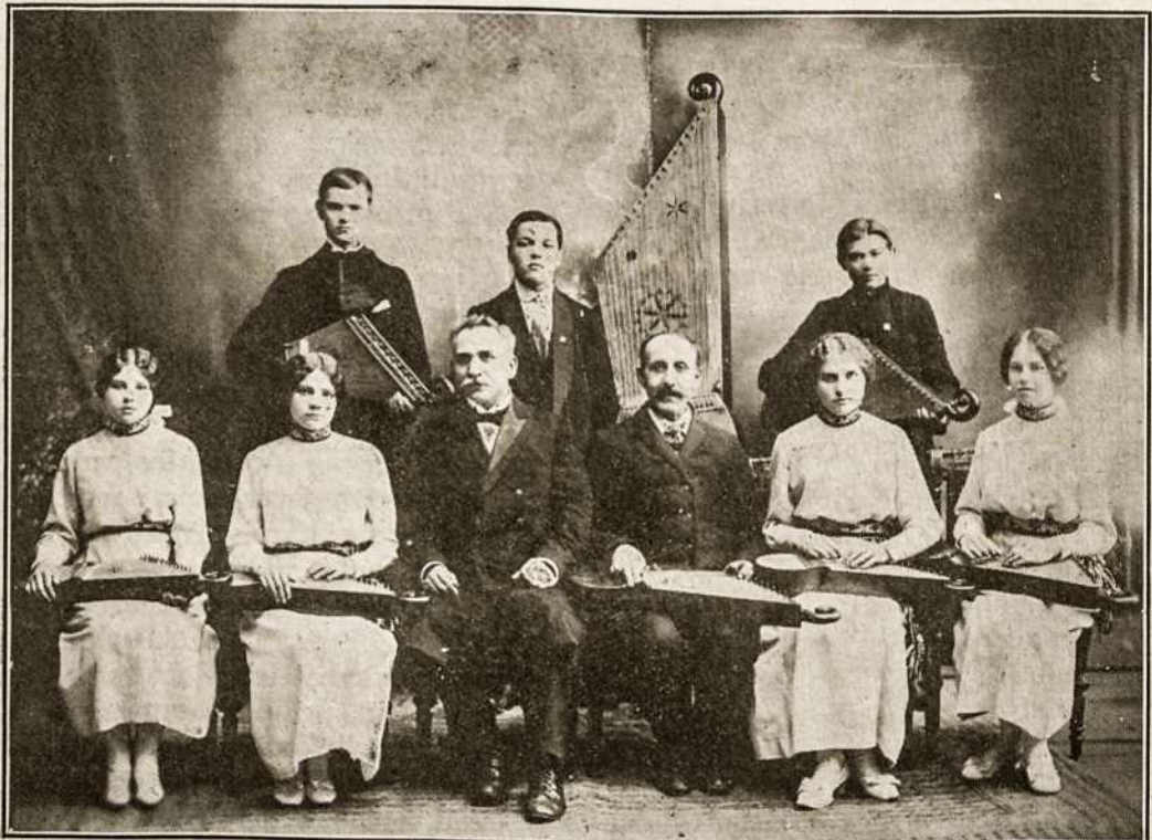
Burelis lietuvių kanklininkų Kaune prieš užimsiant Vokiečiams.