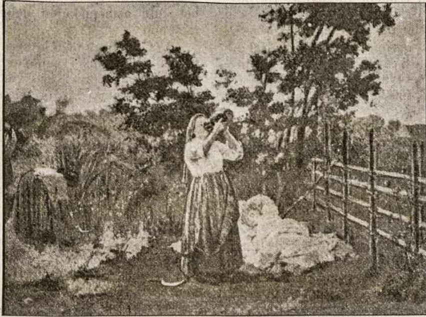
VASAROS DARBAI LIETUVOJE SENIAU.

Šitas vaizdelis parodo, kaip seniau Lietuvoje moterys triusė, kada vyrai turėdavo eiti baudžiavą dvarams ir lenkų ponams.