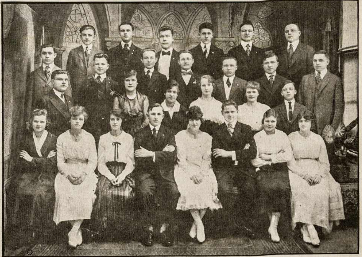
LIETUVOS VYČIŲ 49-ta KUOPA C. BROOKLYN, N. Y.