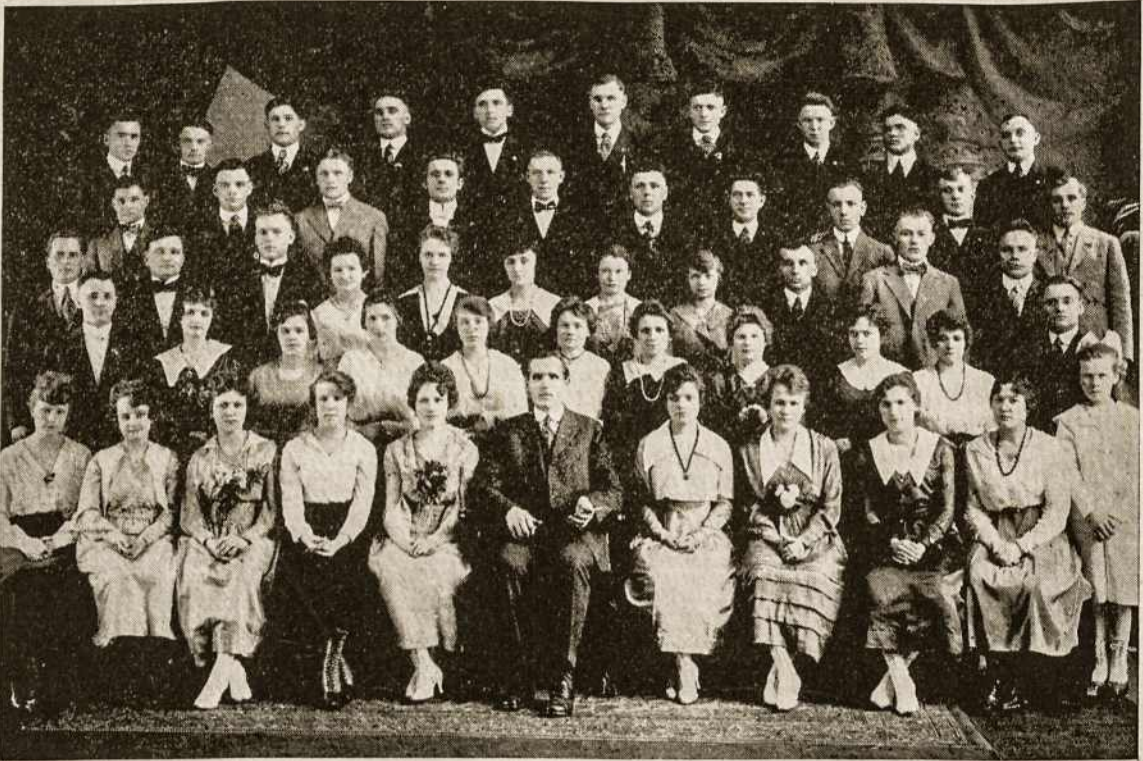
LIETUVOS VYČIŲ 25 KUOPOS CHORAS,