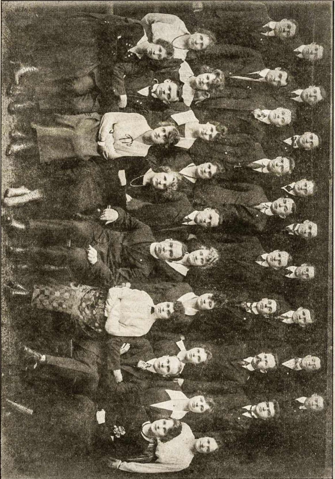
LIETUVOS VYCIŲ 16-ta KP., CHICAGO, ILL. Ši kuopa, neminint jos kitų darbų, Kalėdinin Lietuvos Laisvės Fondan renka 10000 dolerių duoklę (Žiūrėk žinutės apie 16-tą kuopą).