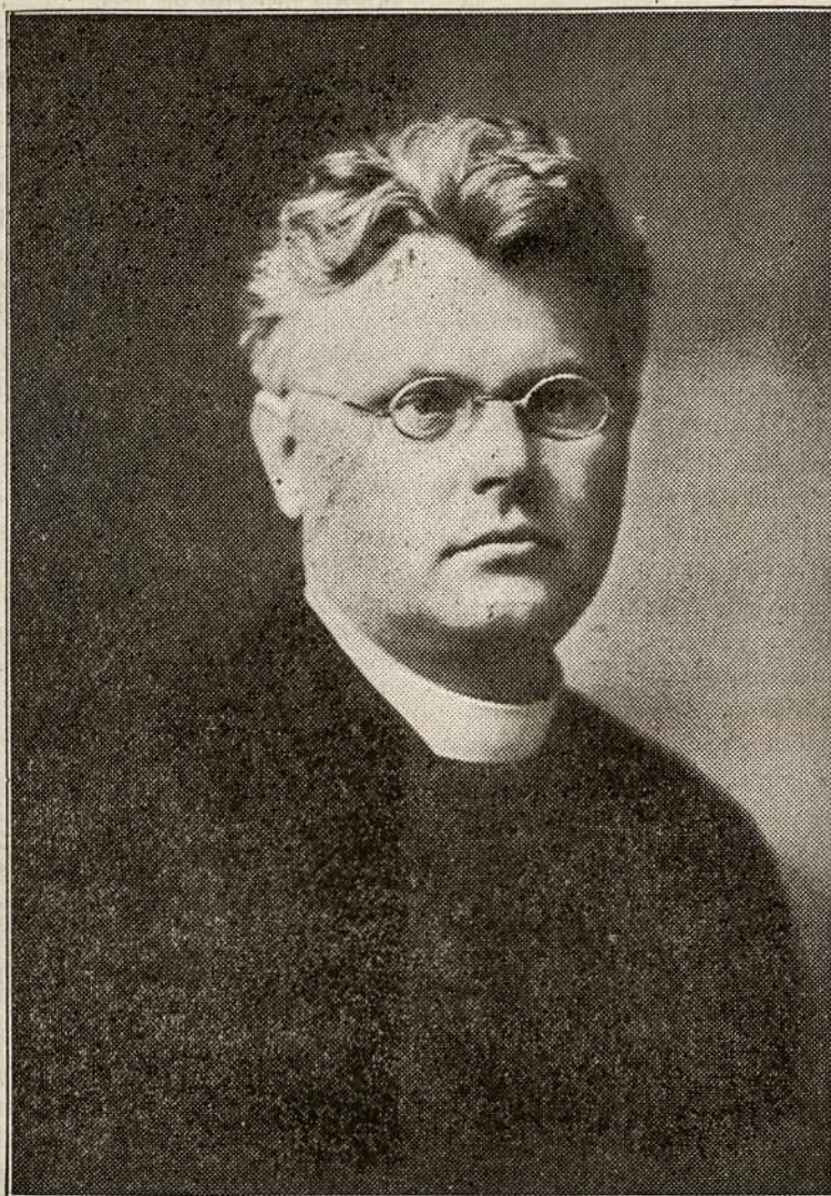
KUN. J. TUMAS (VAIŠGANTAS),

šių (1918) metų lapkričio mėnesio pabaigoje susilaukęs 25 kunigavimo metų sukaktuvių.