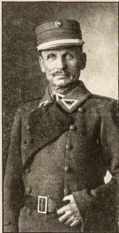
VYRIAUSIAS LIETUVOS KARIUOMENĖS GENEROLAS SILVESTRAS ŽUKAUSKAS.

Vyriausias vadas generolas Silvestras Žukauskas gimė Šiaulių mieste 1865 metais, gruodžio 31 d. Mokėsi Marijampolės gimnazijoje ir Vilniaus karo mokykloje, kurią pabaigęs 1887 metais gavo pirmą rusų kareivijos karininko (oficerio) laipsnį.