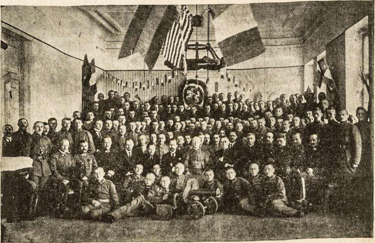
INKURTUVĖS KARINĖS MOKYKLOS KAUNE.

Inkurtuvių iškilmėse dalyvavo prezidentas A. Smetona, J. M. vysk. P. Karevičius ir francuzų karinė misija