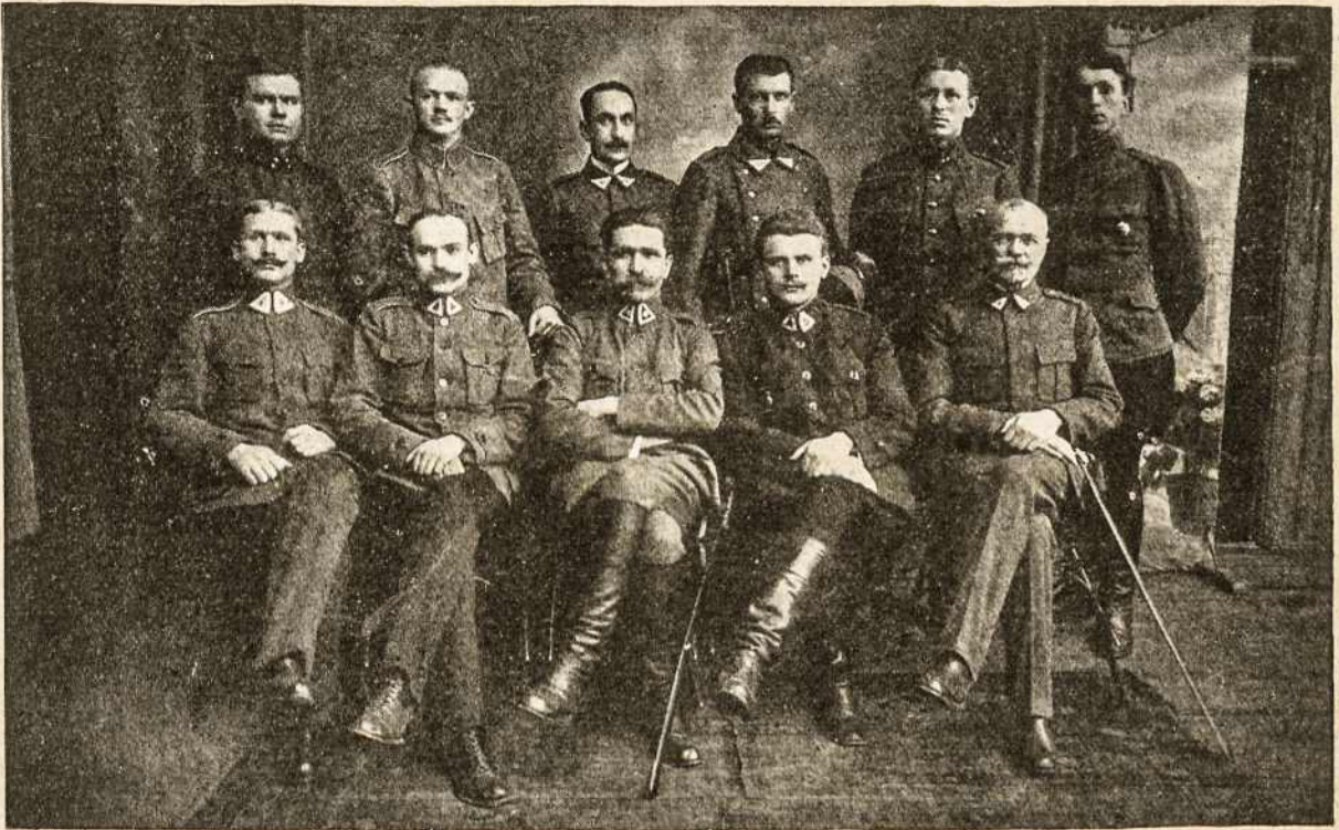
GENERALIS LIETUVOS ARMIJOS ŠTABAS.