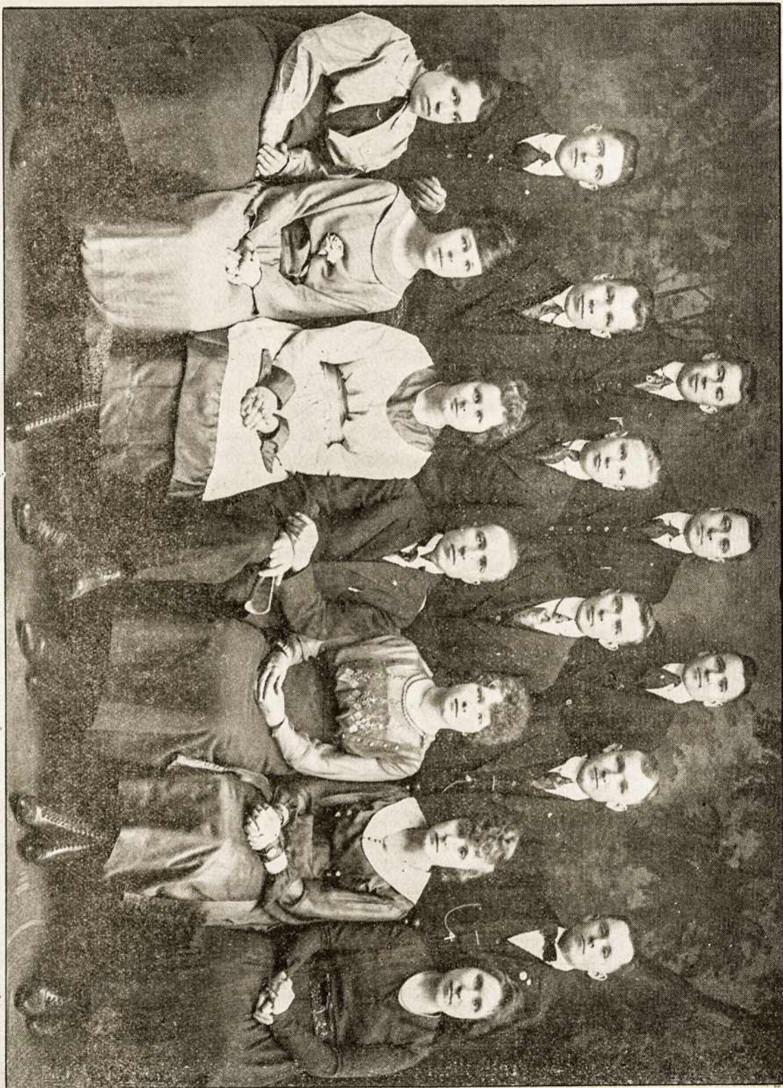
LIETUVOS VYČIŲ 6-TOS KUOPOS HARTFORD, CONN., TEATRALIO RATELIO NARIAI.