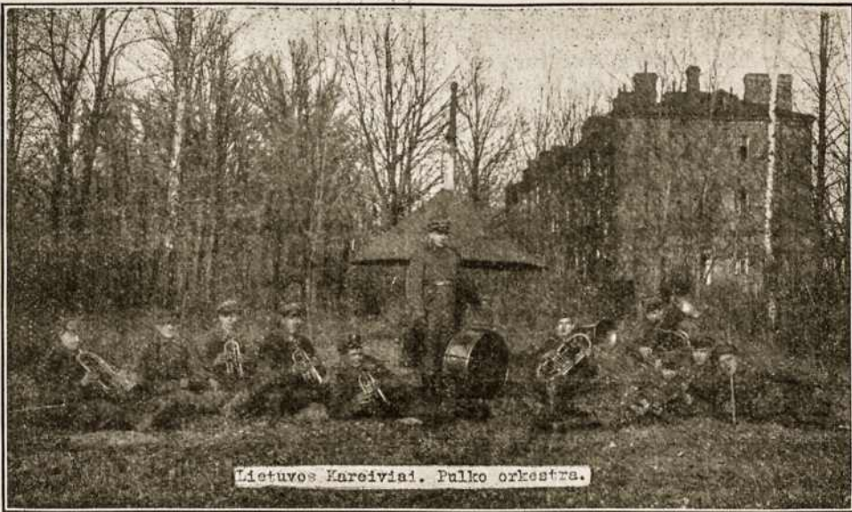
Lietuvos Kareiviai. Pulko orkestra.

Motinių širdys dreba, bet, vilties pilno-