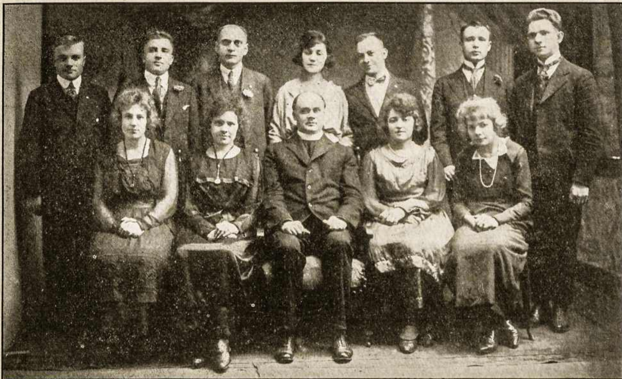
L. VYČIŲ 17 KP. (So. BOSTON, MASS.) VALDYBA, 1919 M.