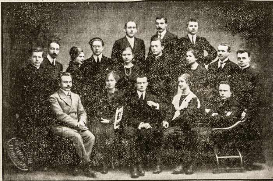
AKADEMINĖ LIETUVIŲ STUDENTŲ DRAUGIJA "LITUANIA", FRIBURGE, ŠVEICARIJOJE.

Nuo savo įsisteigimo dienos — 7 gegužės, 1899 m. iki 7 lapkričio, 1915 m. ši draugija vadinasi "Rūta". Per 20 gyvavimo metų "Rūta-Lituania" yra išleidusi iš savo narių tarpo ne vieną žymų mokslo vyrą, rašytoją, ar visuomenės darbuotoją. Neturint savo universiteto, lietuvių studentų papkriko ir kituose Europos miestuose. "Lituania" duoda paramos dar kitiems savo draugams einantiems mokslą Vokietijos universitetuose.