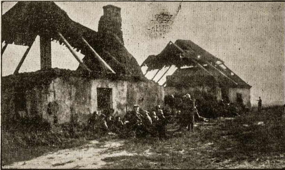
TIK-KĄ IŠVIJUS BOLŠEVIKUS TIES KALKŪNAIS.

4. Tautos Fondas ypatingu būdu kreips domės atgaivinimui tautinio judėjimo krikščioniškoje pakraipoje sulenkintuose Lietuvos pakraščiuose, labiausia Vilniaus gubernijoje, dabar laikinai užimtose lenkų vietose, lenkinimui kurių prieš karą plaukė daug iš Varšuvos pinigų ir dabar jų lenkai nesigaili lenkinimo tikslams.