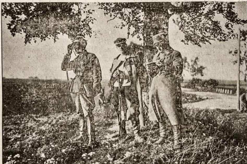
LIETUVOS KARININKAI LENKŲ FRONTE.

išlieti, galvelės padėti... jie mirė, mirė sun- kiose kančiose, žaizdose, bet jų darbai — nemirs!..