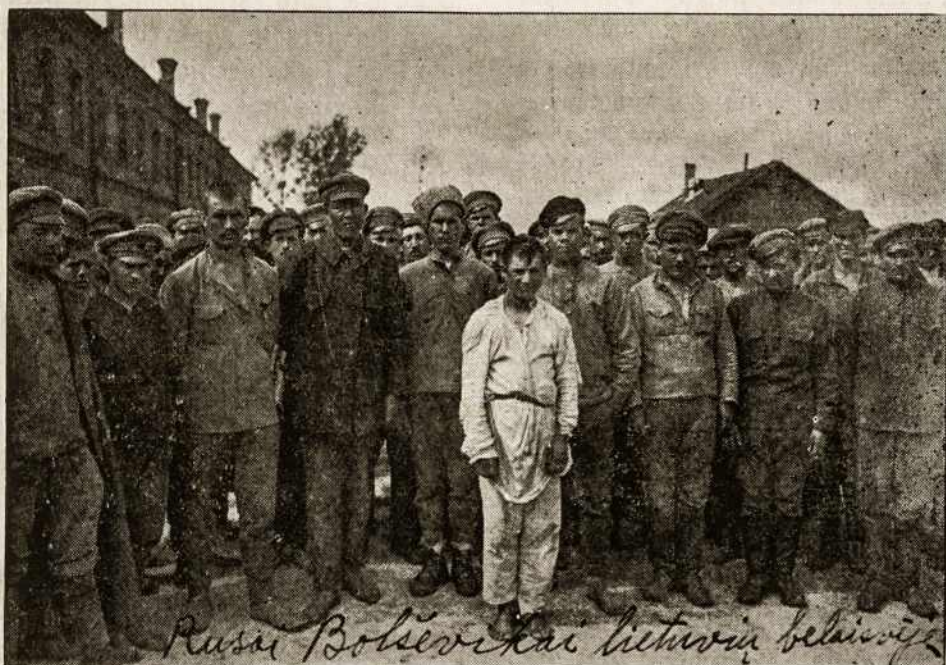
RUSAI BOLŠEVIKAI LIETUVIŲ BELAISVĖJE.

suku — kunigas, su kuriuo stovėjau ir žiūrėjau į rikiuotes, apsiverkęs kai mažas vaikas. Jis pirmu kartu mato mūsų kariuomenę — verkia iš džiaugsmo. Prisiminė man vieno inteligento pasakojimas, kada jis bėgo nuo bolševikų ir šiapus fronto sutiko pirmąjį lietuvių kareivį, apkabino jį, ėmė bučiuoti ir... verkti... Juk penki šimtai metų kai mūsų šalis neturėjo savo sargo — kareivio! Kareivis, nežinodamas kame dalykas, palaikė